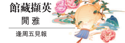
館藏擷英 閒雅 逢周五見報

鑒明永宣時期的抱月瓶而來。另一個體現中西文化交流之處在於，瓷瓶上嬌艷的胭脂紅，其配方從歐洲傳入，為低溫彩釉，因色如胭脂得名，督陶官唐英稱之為「新製西洋紫色」。「春光龍融——上海博物館龍年迎春展」舉行至三月三十一日。