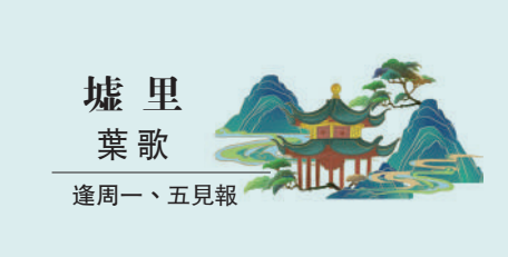
墟里 葉歌 逢周一、五見報

春節回家團聚的執念大概深深復刻在國人的文化DNA中。就像候鳥隨季節遷徙，無論山高水長，風雪嚴寒，都要往家趕。