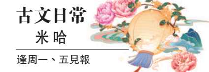
古文日常 米哈 逢周一、五見報

不過，我擔心的是：我們不是不想弄清楚該做什麼可以為之的事，而是當我們面對以上這些換算單位不一又概念不清的標準時，我們實在不能理性地去執行這貌似科學的「快樂計算」。換句話說，要執行快樂計算，倒真的是「挾太山以超北海」一般之不能也。