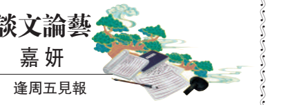
談文論藝 嘉妍 逢周五見報

歷經近百年，馬面裙重回流行，一方面自然得益於近年來內地的漢服運動，越來越多的年輕人開始穿漢服、重拾傳統文化；另一方面，馬面裙簡潔大方、穿着方便，與當代長裙款式類似，風格多變養眼，從明代時期的清新淡雅，到清代的華麗貴氣。二〇二二年Dior的馬面裙事件，雖被認為是品牌文化挪用，其服裝產品有對馬面裙「借鑒」過度之嫌，但也證明了馬面裙的設計與美學，足以登上全世界最盛大最頂級的時裝舞台。無論從文化、從歷史、從美觀、從實用角度而言，馬面裙都是民族服裝的寶藏，此番終於得到市場認可，成為漢服回歸當代生活的第一個「爆款」，令人欣喜。