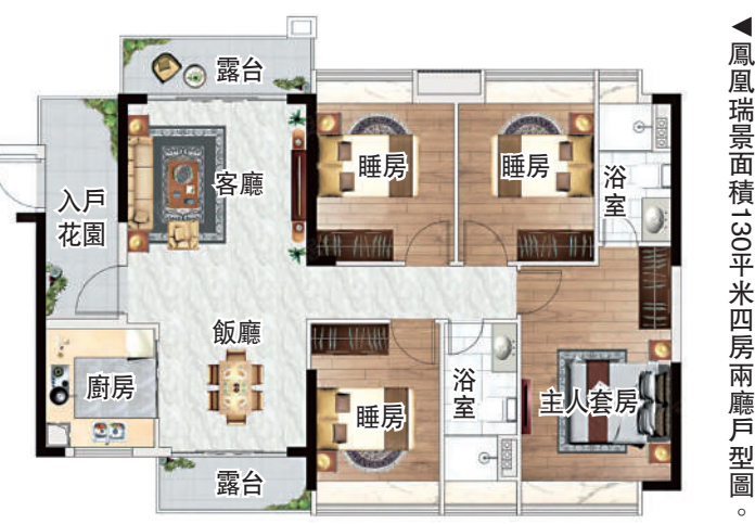
▲鳳凰瑞景面積100平米三房兩廳戶型圖。