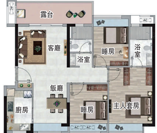
▲頤安·麗都府面積99平米三房兩廳戶型圖。