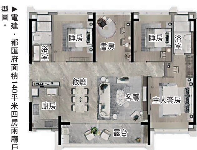
▲電建·都匯府面積140平米四房兩廳戶型圖。

面積120平米單位，呈橫向長方形，三開間朝南，採光充足，U形廚房連接飯廳，有助擴闊空間感，觀景露台闊6.9米，橫跨客廳及其中一間睡房。至於140平米戶型，空間充裕，橫向客廳闊達7米，與觀景露台連接。