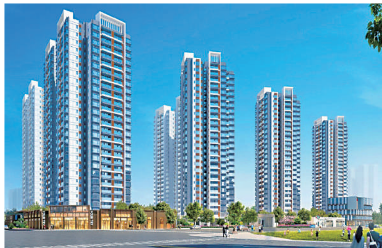
頤安·麗都府建築面積達40萬平方米，正在發售第一期。

花都區城市配套愈完善，醫療方面，目前已有花都區人民醫院、廣州市中西結合醫院、花都區婦幼保健院3家三級甲等醫院，同時計劃推進中山大學附屬仁濟醫院年底前開業，加快廣州市婦女兒童醫療中心花都院區、廣東省中醫臨床研究院項目建設，未來將繼續引進省部屬、市屬公立醫院。此外，未來5年，花都將新建一批社區衛生服務中心和衛生服務站，完善「城市15分鐘、農村30分鐘」就醫圈。