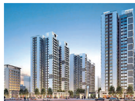
▲鳳凰瑞景建築面積26萬平方米，由14幢物業組成，提供1408個單位。