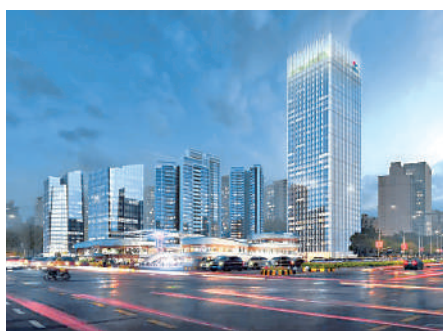
▲電建·都匯府為集住宅、交通、文化、產業等的大型城市綜合項目。