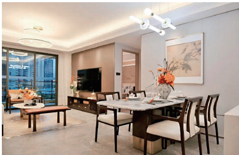
頤安·麗都府戶型由三房起，單位南北對流，空氣通爽。