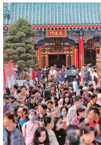
黃大仙祠在元宵節非常熱鬧，人頭湧湧。