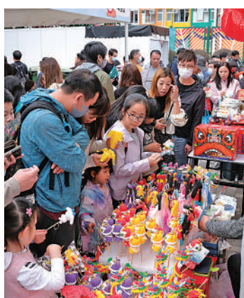
黃大仙市集有不少攤位售賣有傳統文化特色的手工藝品。