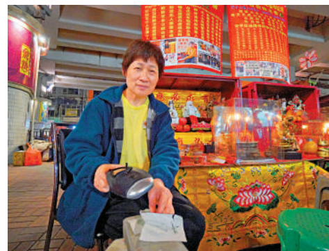
注：「融姑」稱在每個內地居民社交平台，「融姑」稱在每個內地居民社交平台。

少旅客花上最低消費的50元，幫襯打小人，亦有旅客在旁拍攝視頻，分享到社交平台。融姑的檔攤在10分鐘內，便有6位旅客光顧，生意火爆，其他打小人攤檔的生意也不錯。