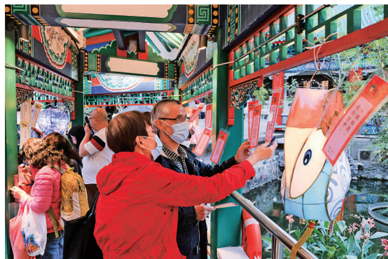
黃大仙祠舉辦元宵會，充滿節日氣氛。

康樂及文化事務署昨日在尖沙咀、將軍澳、天水圍分別舉行元宵綵燈會，在尖沙咀文化中心露天廣場的綵燈會，場內有桃花樹為主題的「夜放花千樹」，打造一個滿園春花的桃花園，吉祥物造型的花燈，以及歌舞、雜技表演和猜燈謎等活動，吸引不少市民及遊客打卡。