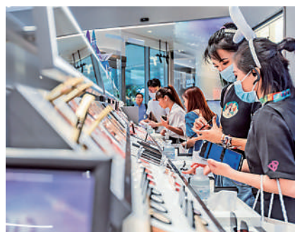
顧客在位於深圳福田星河COCO Park的美妝店挑選商品。