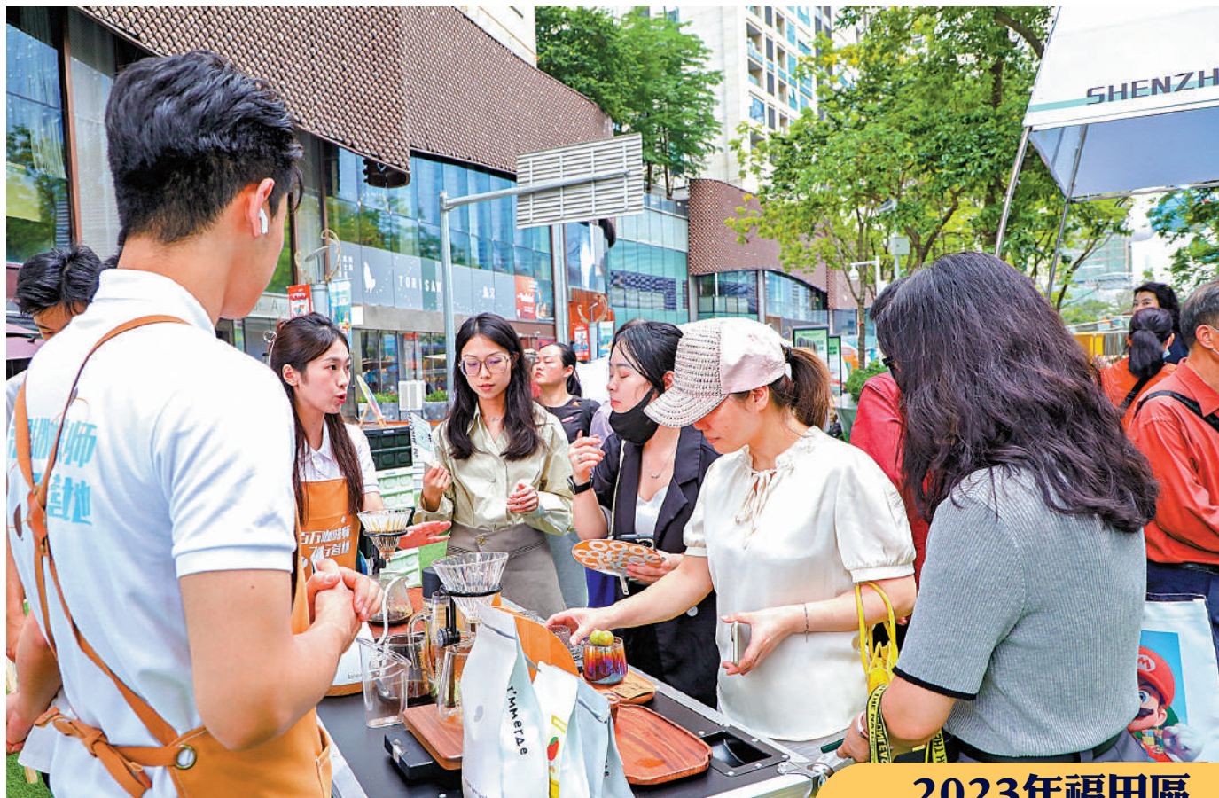
第三屆深圳福田咖啡生活消費節吸引市民到場參觀體驗。

此外，支持品牌茶飲特色化發展，對品牌企業新開設的旗艦店、特色店給予最高100萬元支持。引導茶飲、咖啡店（館）注重設計，發展獨特創意，對舉辦福田特色茶飲活動最高給予100萬元支持。