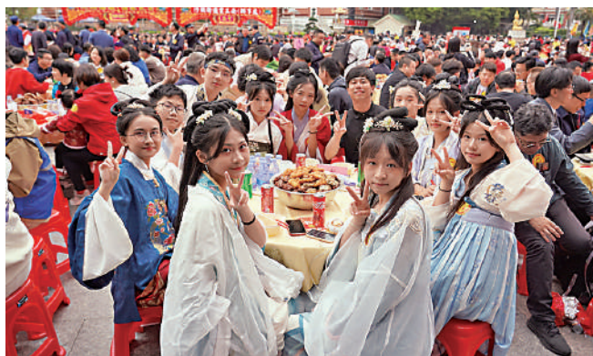
港生們在深圳下沙村體驗盆菜及圍村文化。