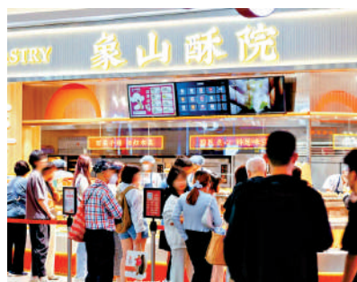
深圳福田一商場內的糕點品牌門店前大排長龍。