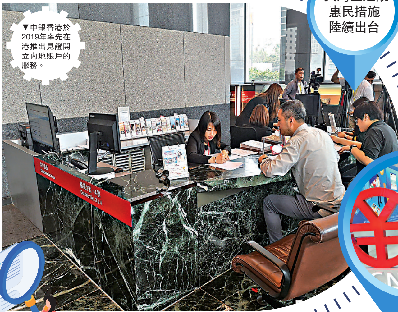
▼中銀香港於2019年率先在港推出見證開立內地賬戶的服務。

2020年6月，南商（中國）深圳分行也獲准加入商事服務「深港通註冊易」試點項目，為有意於深圳前海蛇口自貿區開辦企業的香港投資者，提供商事登記諮詢及代理服務。