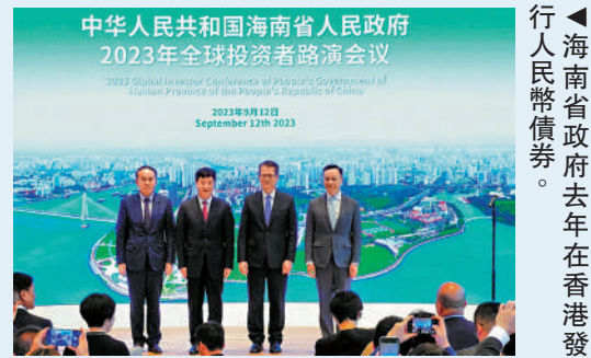
▲海南省政府去年在香港發行人民幣債券。

根據滙豐與中節能皓信攜手發布的報告，大灣區的GSSS（綠色、社會、可持續發展及可持續發展表現掛鉤）債券發行規模在2023年創下新高，達2000億元，按年增長21%。滙豐大灣區辦公室總經理陳慶耀表示，在大灣區加速建設創新驅動型經濟的背景，區內企業低碳轉型的步伐將持續提速，為經濟的高質量發展奠定基礎。