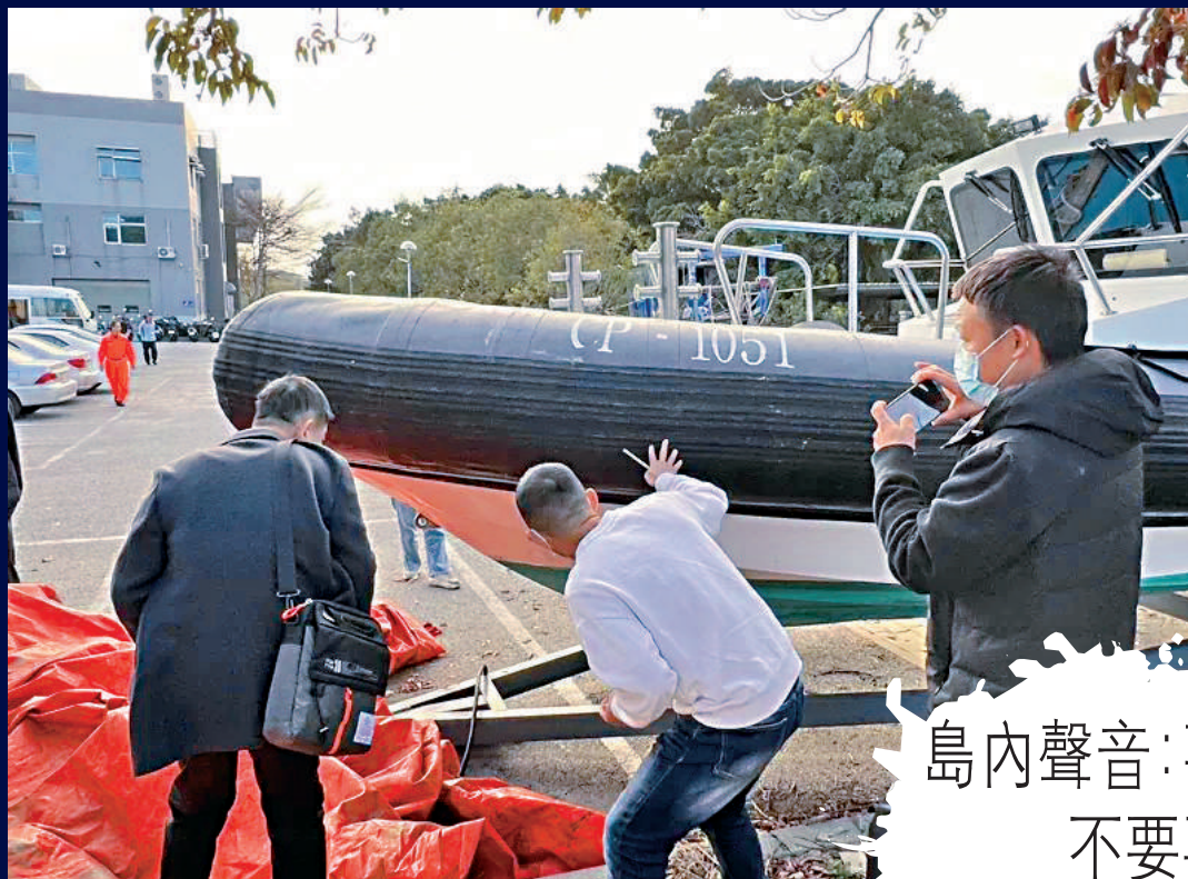
▲2月24日，大陸遇難者家屬到金門海巡隊查看被撞的大陸漁船與肇事海巡艇。圖為陸方察看海巡艇並拍照錄影搜證。

福建一艘漁船2月14日（農曆大年初五），在廈金海域被台方海巡艇粗暴對待，致4人落海，其中2人遇難。新華社23日發表題為《「到底在掩飾什麼？」——台灣輿論追問漁船事件真相》文章。文章指出，這一惡性事件受到兩岸社會高度關注，紛紛要求台海巡單位公布現場錄影以釐清真相。但直到20日，遇難船員家屬抵金門處理善後，金門檢方才披露部分事件訊息，並告知海巡單位沒有現場錄影。島內輿論為之嘩然，連日來一再追問「到底在掩飾什麼」。