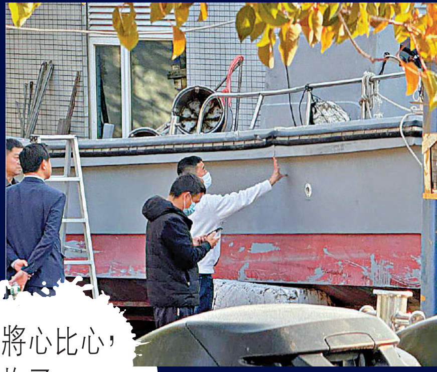
▲遇難者家屬拿起手機拍照、錄影，查看漁船船體被撞擊的痕跡。