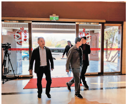
▲24日上午，陸方家屬前往金門海巡單位就有關事宜磋商。

簡言之，2名大陸船員遇難一周後，一些最基本的真實情況才得以曝光。但距離遇難者家屬和兩岸社會大眾需要的還原整個事件全部真相，還有多遠？