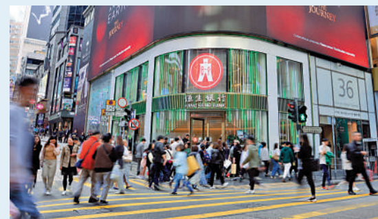
本港銀行紛紛推出新理財產品吸引新客戶及新資金。

恒生銀行（中國）今日起為客戶提供的合資格「跨境理財通」產品（包括南向通及北向通）將增加至超過320款，較2021年正式啟動時上升近1倍，涵蓋不同風險的理財產品以迎合多元化的客戶需求。當中主要投資大中華股票的基金選擇由「低至中」風險評級擴展至所有風險評級，而其他基金選擇則由「低至中」風險評級擴展至「低至中高」風險評級。