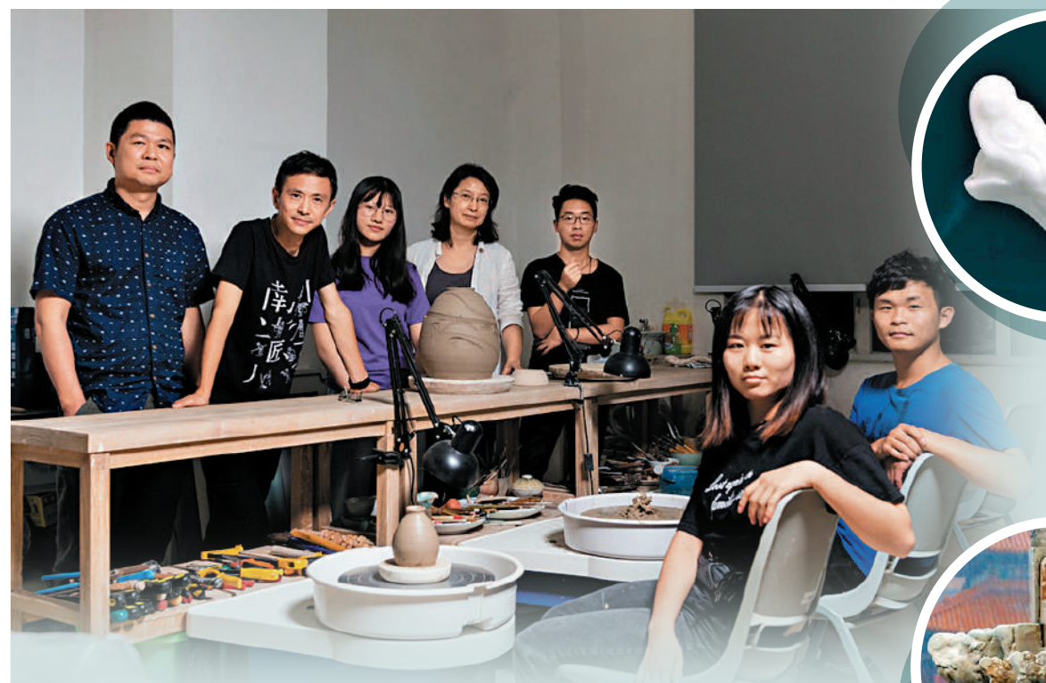
▲懷着工匠夢想的十多位藝術家正式組成了「南山匠人」團隊，設計獲得多項國際國內大獎。