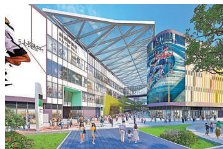
▲啟德體育園的零售部分名為啟德零售館，總樓面近70萬方呎。

啟德零售館總樓面近70萬方呎，主建築共3座，每座最多5層，由700米長的體育大道與園區相連接，啟用後將成為全港最大運動體驗及購物遊樂新地標。為配合啟德體育園發展方針，啟德零售館將會引入香港慶熙跆拳道、香港專業空手道訓練學校、香港專業花式跳繩學校等多間頂尖運動學院，並邀得曾三度獲世界冠軍的花式跳繩教練文家