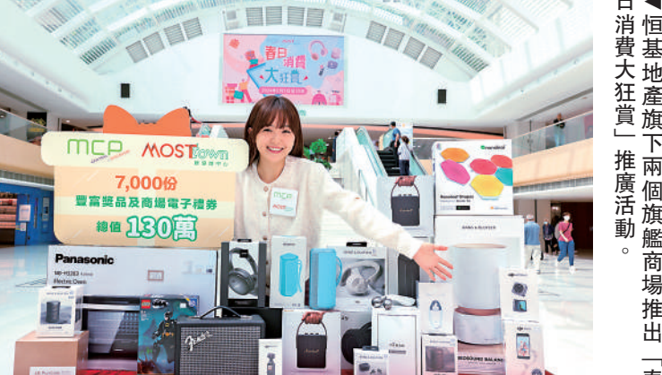
▲恒基地產旗下兩個旗艦商場推出「春日消費大狂賞」推廣活動。

申請新酒牌公告 中國通 現特通告：韓洋其地址為香港坪洲坪利路12號寶翠灣1號35室，現向酒牌局申請位於香港坪洲坪利永安街75號地下中國通的新酒牌。凡反對是項申請者，請於此公告刊登之日起十四天內，將已簽署及申明理由之反對書，寄交香港灣仔軒尼詩道225號路政道市政大廈8字樓酒牌局秘書收。 日期：2024年2月27日