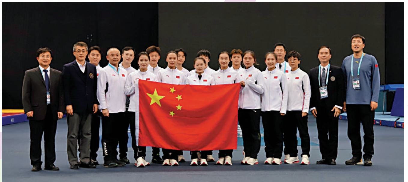
中國蹦床隊在世盃巴庫站奪得佳績。

【大公報訊】新華社報道：2024年國際體聯蹦床世界盃首站巴庫站比賽北京時間25日落幕，中國蹦床隊斬獲3金2銀，取得開門紅。本站世盃是巴黎奧運會資格賽，也是今年中國蹦床隊首次亮相國際賽場。根據規則，去年和今年共有5站世盃分站賽為奧運資格賽，中國蹦床隊已在去年取得滿額奧運參賽資格。