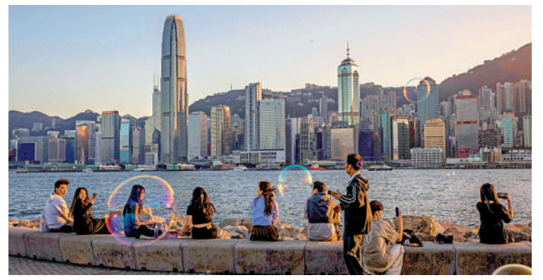
▲維港海濱將加入商業設施，估計包括餐飲和表演等，提升海濱吸引力。

灣仔海濱活動空間頭炮項目「迷趣海濱」將於3月15至24日舉行，一連10天免費開放。活動以五大迷宮為主題，融合創意藝術、玩樂、打卡和冒險元素，為置身於迷宮內的遊人，帶來別開生面的沉浸式玩樂體驗。「迷趣海濱」設計團隊由多位跨界別的藝術和創意專才組成，五大迷宮包括以光影為主題的「迷時」、以鏡面為結構的「鏡院」、以竹為元素的「迷走竹林」、以燈光變化組成的「光盒子」，以及為好動小朋友而設的「躍動迷城」。