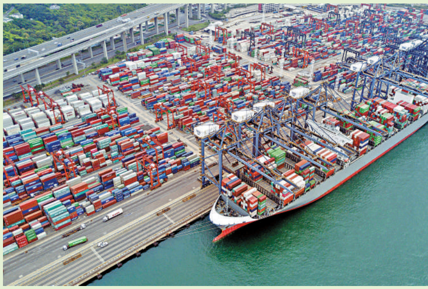
▲預算案將增撥資源，完善航運綠色能源配套，包括展開甲醇燃料加注可行性研究。

財政司司長陳茂波將於明天發布新一份預算案，拚經濟、謀發展，為香港增添新的發展動能，預料將會是其中一個重點。消息指出，財政預算案會在綠色經濟發展有多處著墨，促進多項綠色發展。