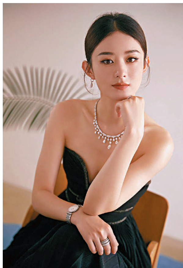
趙麗穎表示獎項對她來說是一種激勵。