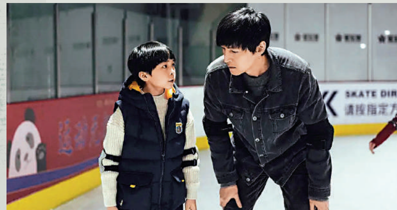
電影《不虛此行》劇照。

影片中的當下北京城市人物群像，如同劉伽茵和聞善的編劇觀察生活筆記，而且都指向了北京這個儲存層層意義的重大城市，所經歷的高速運轉及其中萬千普通人的具體記憶。上述人物沒在各自歸屬的場合和時空，共同構築了「摺疊」北京，生死悼詞的謀篇布局正出自於生活褶皺的字裏行間。