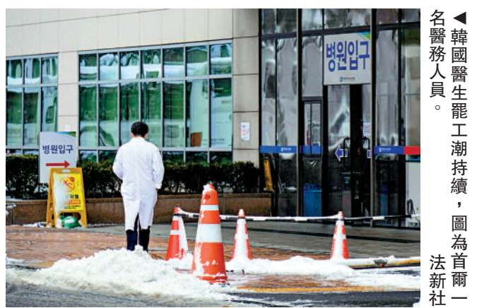
韓國醫生罷工潮持續，圖為首爾一名醫務人員。

韓國總統尹錫悅27日繼續保持強硬態度，強調醫療改革「不容談判或妥協」。韓國當局敦促離崗醫生在本月29日以前返崗復工，並警告將對拒絕復工的醫生採取司法手段，違者將面臨吊銷行醫執照、禁止行醫以及監禁的處罰。根據保健福祉部27日公布的數據，全國99家醫院中，實習住院醫生共9909人提交辭職報告，佔總數的80.6%。缺勤醫生達8939人，佔72.7%。