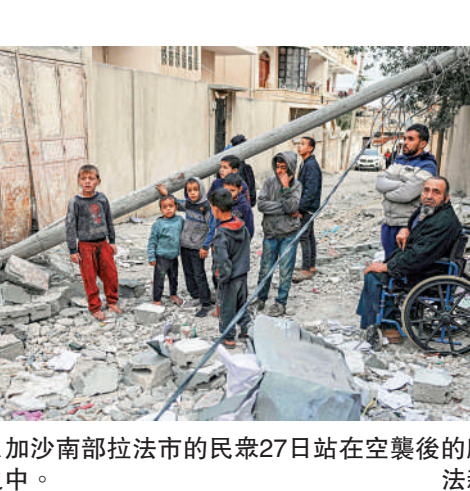
加沙南部拉法市的民眾27日站在空襲後的廢墟之中。

【大公報訊】據法新社報道：美國總統拜登26日表示，他希望以色列和哈馬斯能夠在下周一（3月4日）前實現加沙停火。對此，哈馬斯27日表示，拜登言之過早，與地面情況不符，現時距離停火還有很大的距離。另外，路透社指哈馬斯已經收到停火協議草案。