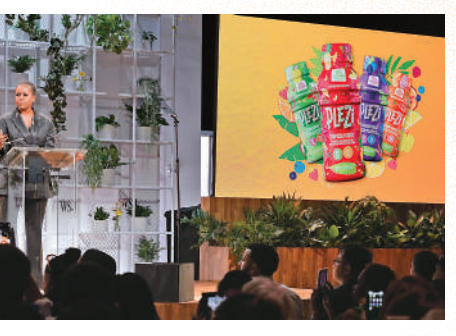
▲去年5月，米歇爾為自家飲料品牌Plezi做宣傳。