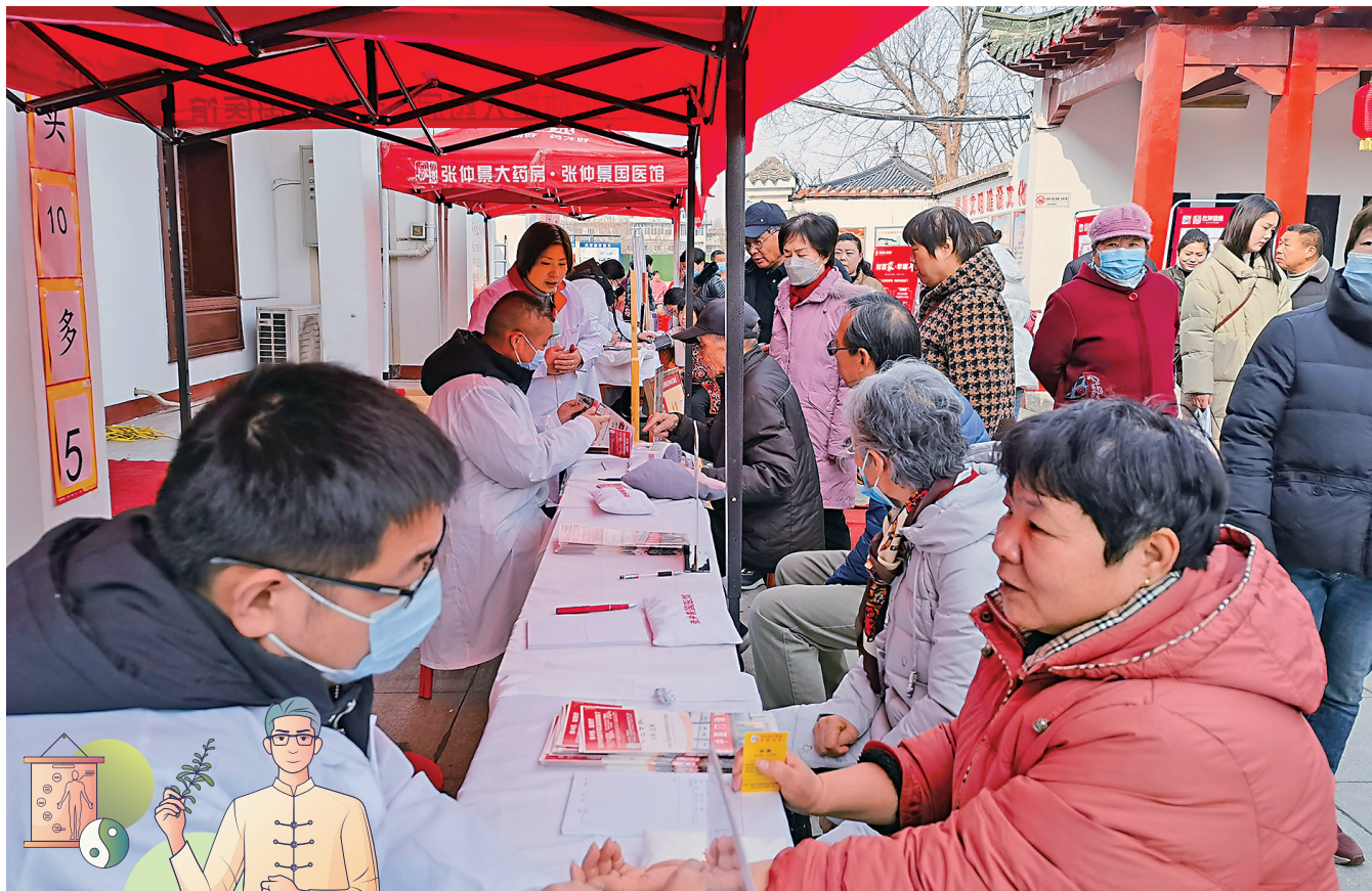
▲河南南陽百姓有濃厚的「信中醫、愛中醫、用中醫」傳統，當地會組織中醫大夫為群眾把脈問診。