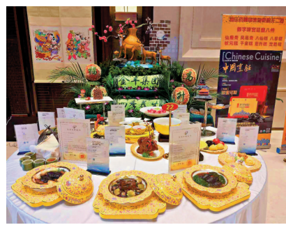
▲在首屆仲景藥膳文化論壇及藥膳大賽上，眾多藥膳食品一決高下。

得天獨厚的優勢，因南陽是張仲景故里，在保護知識產權的基礎上，若能善加利用張仲景的經方，開發成藥膳，定能惠及百姓，同時能夠為南陽中醫藥「出海」助一臂之力。