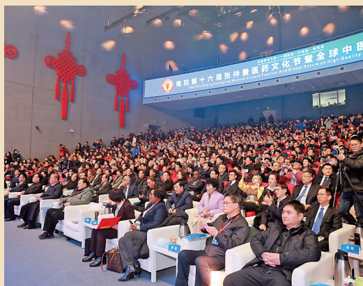
▲第十六屆張仲景醫藥文化節開幕式現場。

南陽古稱「宛」，是國家歷史文化名城。近年來，南陽依託自身深厚的中醫藥文化底蘊，積極建設國家中醫藥綜合改革試驗區，着力打造全球中醫聖地、全國中醫高地、全國中醫名都。如今，南陽已成功打造張仲景醫藥文化節、仲景論壇、仲景書院等品牌。