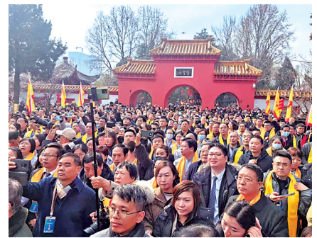
▲在「醫聖」拜謁大典現場，人流如鯽。

雖然拜謁大典定於27日10點半舉行，但不到10點，醫聖祠早已人流如鯽，主祭台被「朝聖」的人們圍得水洩不通。隨着主祭官一聲令下，拜謁儀式正式開始。在莊重的氣氛中，現場全體肅立，高聲奏唱《醫聖頌》，並向醫聖張仲景先師墓敬獻花籃和八大宛藥。隨後，主祭官恭讀《祭文》，全體參加拜謁的專家學者向醫聖張仲景墓行三鞠躬禮，繞行醫聖墓一周，瞻仰醫聖仲景先師。