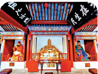
▲「醫聖祠」中的張仲景像。