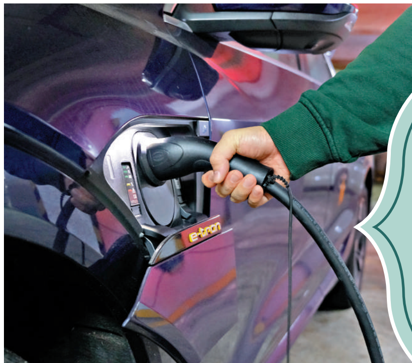
▲政府鼓勵更廣泛使用電動車，電動車「一換一」計劃推出後反應良好。

陳茂波表示，全球各經濟體也朝着碳中和的目標前進，整個綠色轉型的過程帶來龐大的商機和融資需要，並形成豐富的產業群。