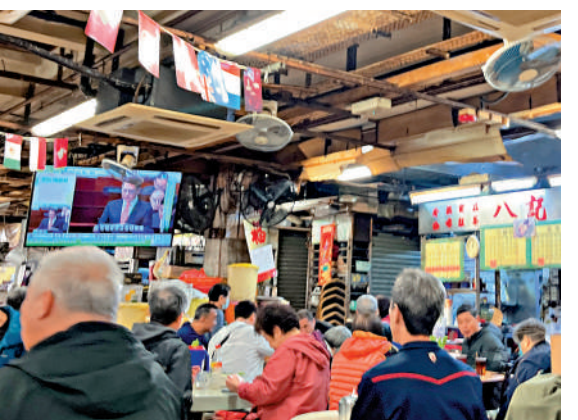
▲市民非常關注預算案新措施，普遍反應表示歡迎。