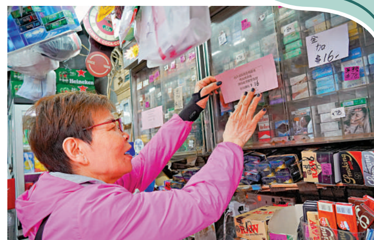
▼預算案宣布加煙稅，零售商即時加煙價。