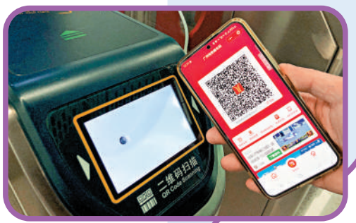
▲城際鐵路變身「升級版地鐵」後，旅客進站可使用地鐵乘車碼。

鐵」。相比一般的城際鐵路，這兩條線路都無需按車次購票候車，進站可以直接使用公交卡和地鐵乘車碼。「城市間地鐵互聯互通、城際鐵路和地鐵互聯互通，只要在技術層面做好，是可以實現的，甚至跟高鐵都可以。」廣州地鐵集團有關負責人坦言，從已有實踐線路來看，軌道交通出行「一票制」的技術障礙並不大。「但各城市間的行政壁壘必須打破，才能促使不同城市的列車相互通行各自的城市中心「常態化」，做到一張軌道交通網，一張票通行。」 大公報記者方俊明