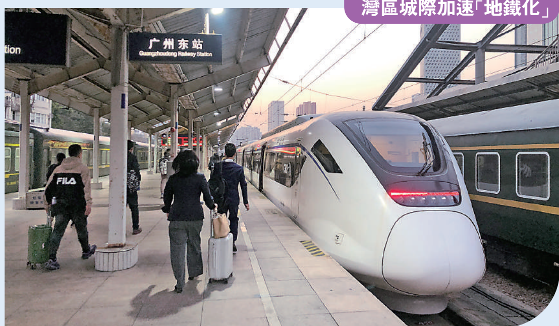
▲國家鐵路局28日表示，擬於粵港澳大灣區試點軌道交通「四網融合」。圖為旅客在廣州東站搭乘城際列車。