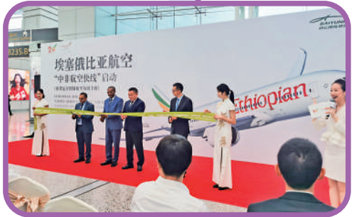
▲埃塞俄比亞航空「中非航空快線」啟動儀式在廣州白雲機場舉行。資料圖片

▼去年10月，埃塞俄比亞航空「中非航空快線」啟動儀式在廣州白雲機場舉行。資料圖片