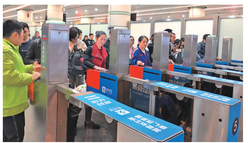
▲旅客可使用支付寶搭乘廣深鐵路等城際線路。

「四網融合」是指推動幹線鐵路網、城際鐵路網、市域（郊）鐵路網和城市軌道（地鐵）交通網「四網融合」，打造軌道上的城市群都市圈。費東斌稱，加快推動軌道交通「四網融合」發展，重點做好加強規劃引領、加強標準支撐、加強統籌協調三個方面的工作。