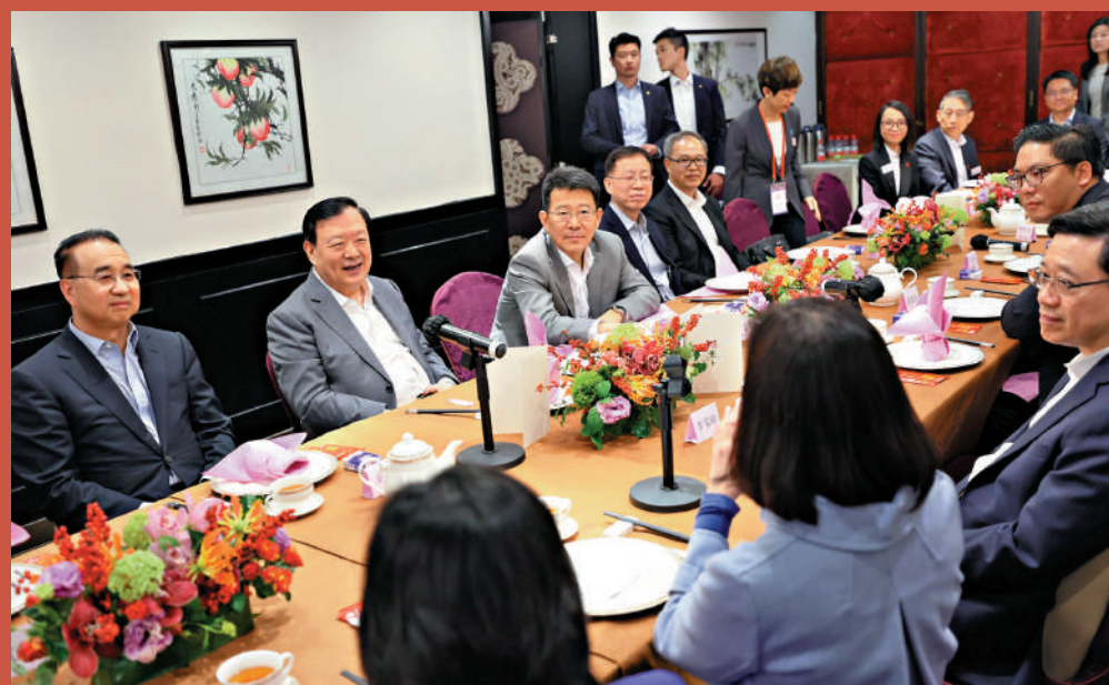
▲2月24日，夏寶龍與香港十八區區議會主席會面並共進工作午餐。中央港澳辦

夏寶龍於22日抵達香港，他指出，此次來港考察調研，是貫徹落實習近平主席去年12月聽取李家超行政長官述職時的重要講話精神，實地了解香港經濟發展、地區治理等情況，與特區政府和社會各界共同謀劃香港新階段新發展，以更好維護香港長期繁榮穩定，推動「一國兩制」行穩致遠。