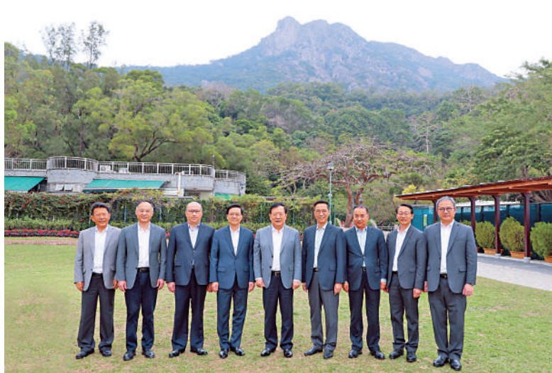
▲2月24日，夏寶龍參觀九龍獅子山公園。