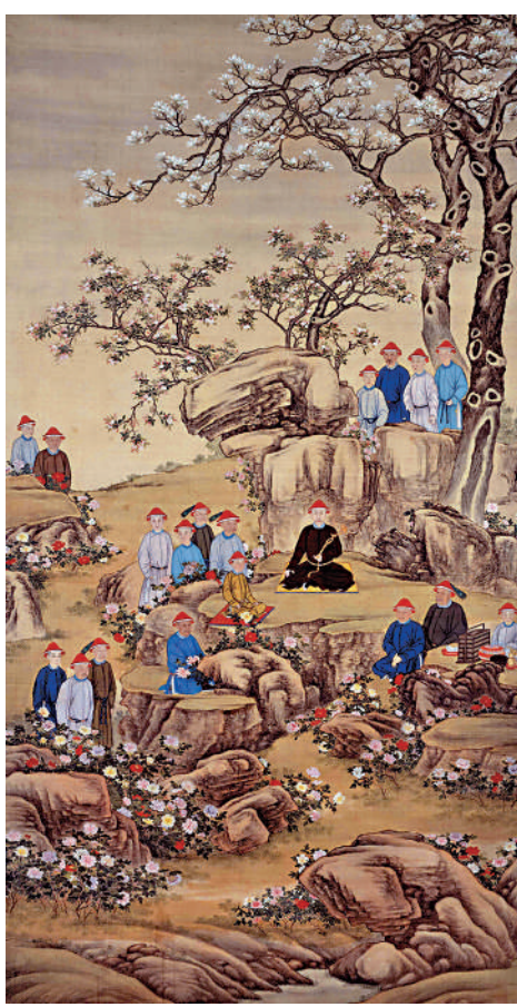
▲「圓明園——清代皇家園居文化」展《雍正帝牡丹觀花行樂圖》。