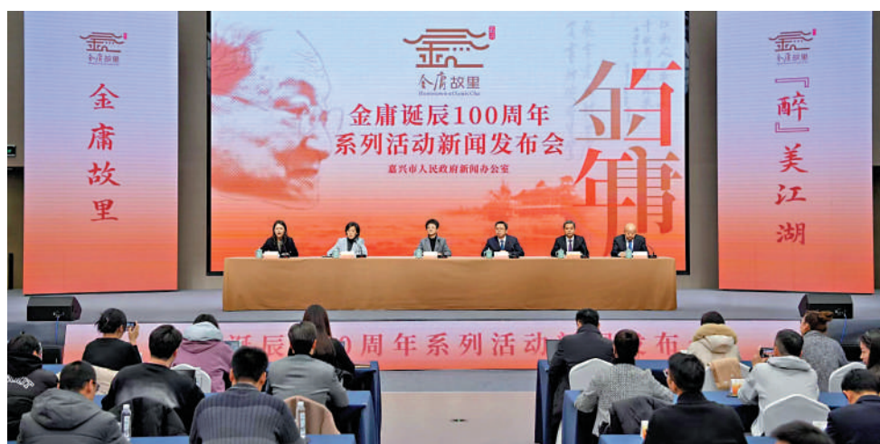
▲金庸誕辰100周年系列活動新聞發布會在浙江嘉興舉行。