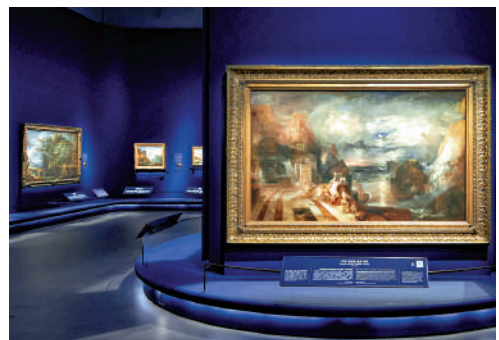
▲「從波提切利到梵高——英國國家美術館珍藏展」特別展覽現正展出。