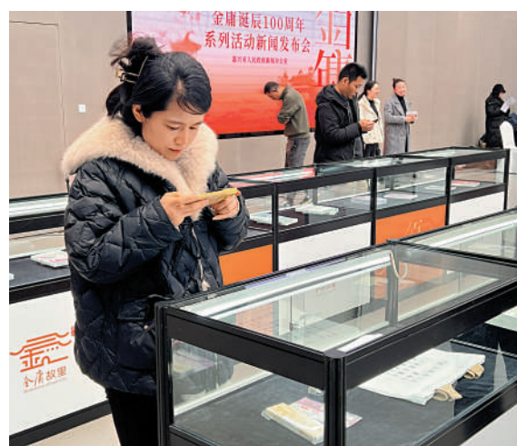
▲觀眾參觀金庸《笑傲江湖》等作品展。