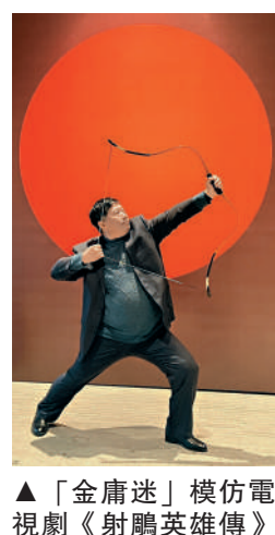
▲「金庸迷」模仿電視劇《射鵰英雄傳》場景。

「嘉興是金庸先生出生地、少年成長地。多年來，嘉興堅持講述金庸先生『俠之大者』背後的深厚情懷和『江湖一夢』背後的家國故事。」嘉興市委宣傳部常務副部長梁曉英介紹，在3月11日即將舉辦的金庸先生誕辰100周年文化交流活動上，嘉興將面向全球發布《書劍恩仇錄》故鄉版、金庸浙江地圖《金庸江湖28景，浙里圖鑒》、短視頻《金庸筆下的嘉興》等一系列標誌性成果，推動先生「俠之大者，為國為民」的精神品格走出國門、走向世界。同期，金庸百年紀念展和金庸故居也將開展、開放。