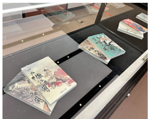
▲發布會現場展示部分金庸作品。