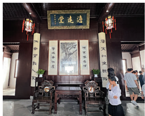
▲金庸故居中的「滄遠堂」，堂名為康熙所賜。