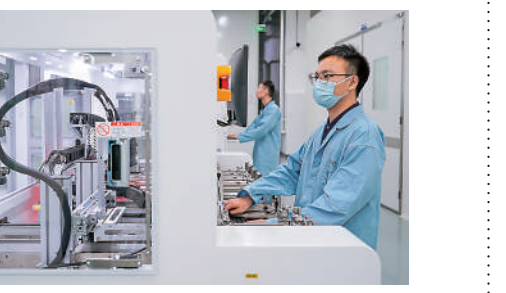
▲蘇州一家科技公司工作人員在研發車間內操作先進封裝芯片測試機。

第六批全國幹部學習培訓教材由全國幹部培訓教材編審指導委員會組織編寫，共9本，包括4本理論教材《深刻領悟「兩個確立」的決定性意義》《習近平新時代中國特色社會主義思想的世界觀和方法論》《推進新時代黨的建設新的偉大工程》《推進和拓展中國式現代化》和5本《推進和拓展中國式現代化案例選》。