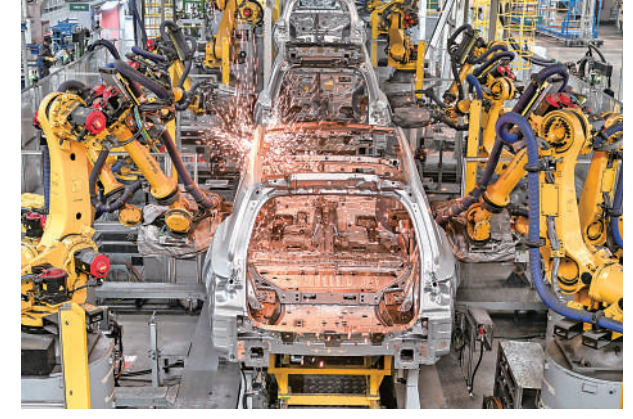
▲1月10日，在理想汽車江蘇常州基地車間，機械手臂進行焊接作業。 新華社