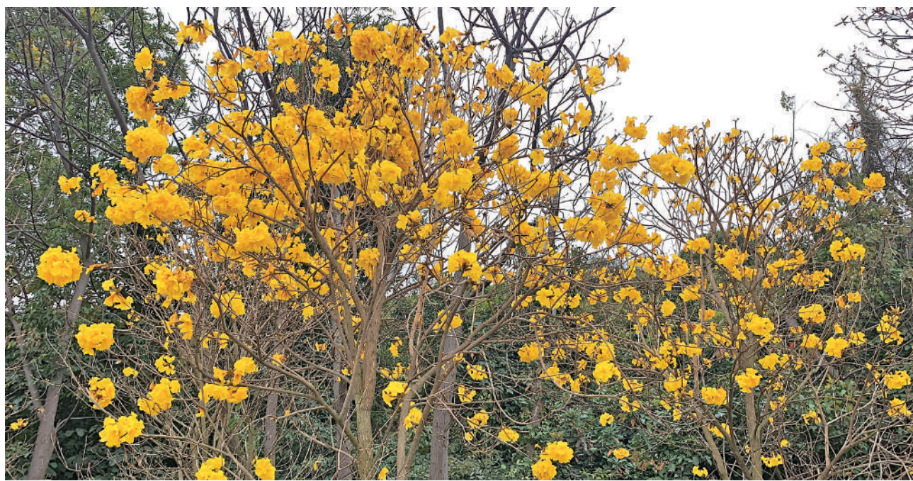
▲機場風鈴徑的黃花風鈴木正值花期。