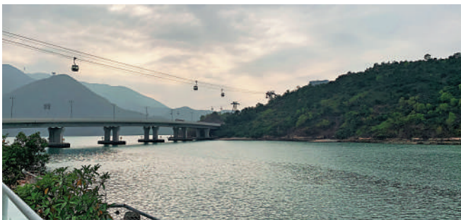
▲沿着東涌海濱道散步，別有一番風情。