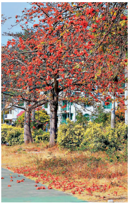
▲木棉花盛放，本港不少地方都可以觀賞。

三月的香港春暖花開，正是賞花郊遊的好時節。杜鵑花、宮粉羊蹄甲、櫻花、木棉、黃花風鈴木等在城市的大街小巷盛放。港島、九龍、新界的多個公園內，微風吹過便可聞到淡淡花香，落花亦將街道風景裝點得更為生動。除了市區的公園，位於東涌的機場風鈴徑是不可錯過的賞花熱點，不少攝影愛好者慕名而來。在機場緩跑徑一帶沿路種有260棵黃花風鈴木，兩排滿目黃金的樹，置身於花海中，同時可看到飛機的起落，別有一番風味。