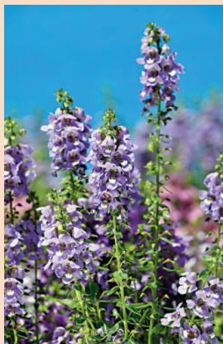
▲今屆香港花卉展覽以香彩雀為主題花。