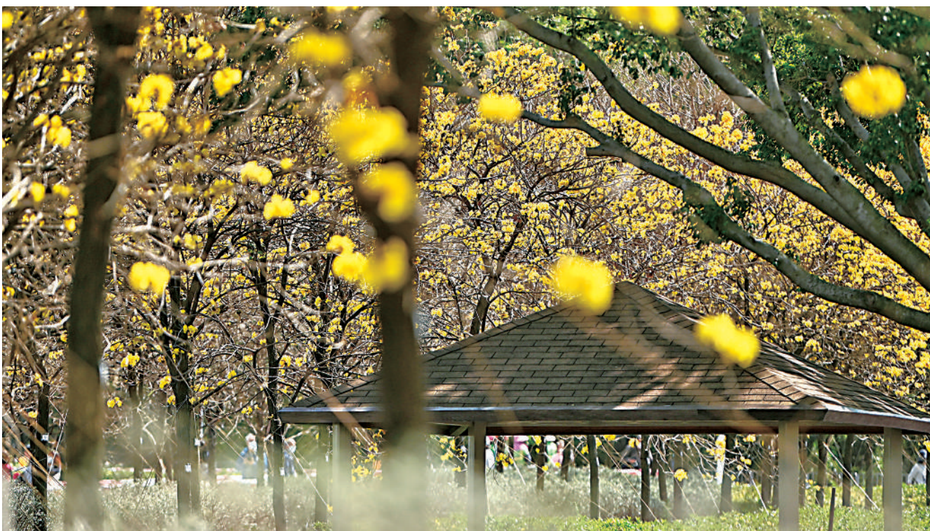
▲機場風鈴徑位於東涌國泰城、古窰公園及機場古物園旁。

機場風鈴徑位於東涌國泰城、古窰公園及機場古物園旁，從東涌步行前往需30分鐘可到達。從東涌港鐵站出來，穿過東薈城和昂坪360，來到東涌海濱一帶，從這裏可以眺望對岸的山、運行着的纜車，遠處的港珠澳大橋在海天之間依稀可見。在達東路花園的加水站後面，有一條通往對岸的人行天橋。走上天橋便來到赤鱗角南路，頭頂的纜車來去自如，橋兩岸的風景山清水秀，令人流連忘返。走