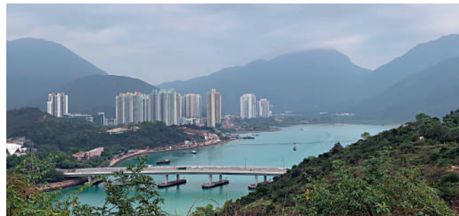
▲觀景山山頂視野開闊。