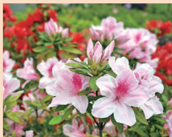
▲杜鵑花花期在3至4月。