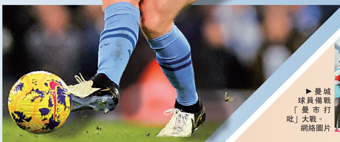
曼城球員備戰「曼市打吡」大戰。

曼城即將出戰英超主場對曼聯的「打吡」大戰，復出後的迪布尼狀態大勇，只要他與夏蘭特繼續炮製兩個入球，迪布尼便能成爲近10年歐洲五大聯賽助攻最多的球員，值得一讚是，迪布尼目前只踢441場便獲得202次助攻，美斯要踢458場才有203次助攻，數字上迪布尼效率更勝一籌。即使他今場未能壓過美斯，由於美斯已離開歐洲五大聯賽，故此，迪布尼必定成爲近10年歐洲五大聯賽助攻王，只是時間問題。