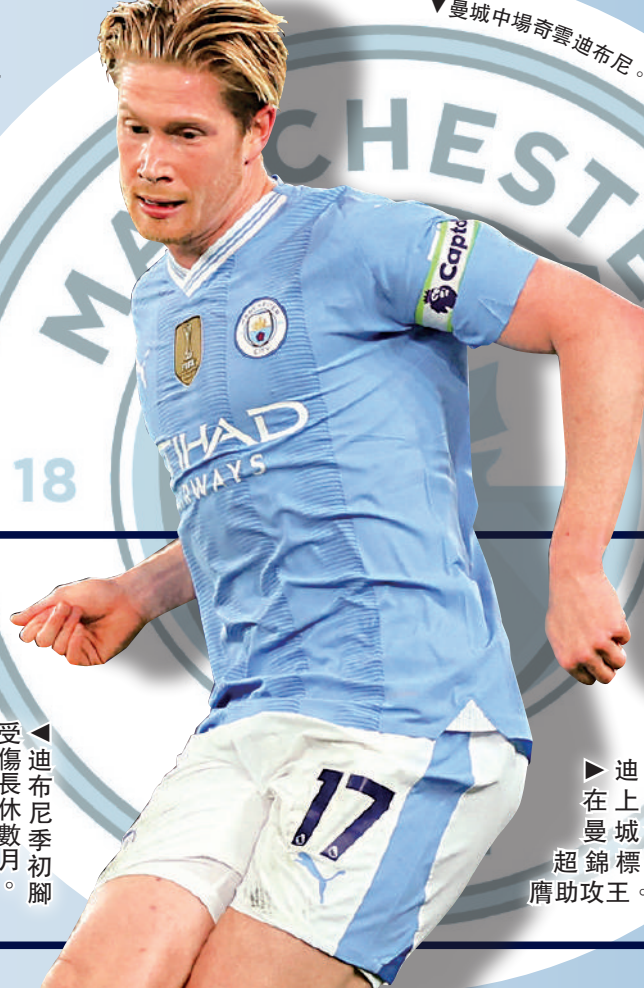
曼城中場奇雲迪布尼。