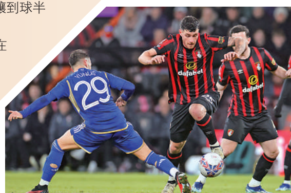
般尼茅夫(紅黑衫)上仗英足盃打和李斯特城。

【大公報訊】綜合ESPN FC、香港賽馬會足彩智報道：英超今晚將在曼城主場上演備受矚目的「曼市打吡」，論實力，目前曼市已是「藍月亮」曼城的天下，「紅魔鬼」曼聯明顯不及，目前更是傷兵滿營。近況出色的曼城佔主場之利，取勝可說是胸有成竹，「讓球」曼城即使讓到球半/兩球仍可照投注上盤一博。(NOW621及611今晚11時30分直播)「曼市打吡」向來是受關注的賽事，以往都打得特別精彩刺激，就在今季的上半季，實力強大的曼城便於作客情況下大勝曼聯3:0，來到下半季，兩支同市球隊於英超次循環再度碰頭，今次雙方條件更懸殊，不僅改由曼城佔主場之利，更有迪布尼復出，與前鋒艾寧夏蘭特爭取入球，其餘如菲爾科頓、祖利安艾華利斯等人都狀態大勇，曼城今年更於各項賽事錄得10勝1和的不敗佳績，預計今仗曼城可望繼首循環後，再次大勝而回。曼聯目前陣容本已不及曼城，更不幸的是，前者有多名傷兵，當中包括前鋒海倫、後衛哈利馬古尼及雲比沙卡等8名主力球員，就算般奴費南迪斯最終再帶傷上陣，也難望拉近雙方距離，隨時又大敗一場。