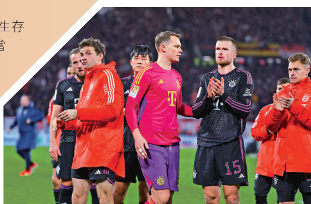
拜仁(黑衫)在德甲被弗賴堡逼和。