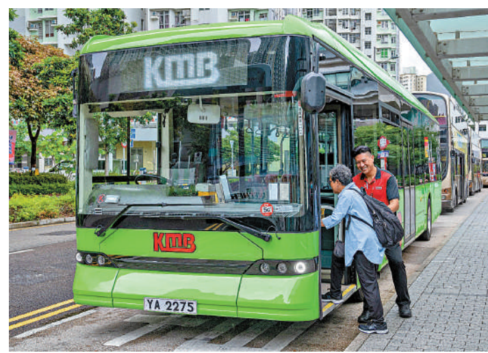
▲當局強調無意變動2元乘車優惠計劃的受惠年齡。

運輸及物流局局長林世雄日前則表示，公共交通費用補貼計劃有逾200萬人受惠，會在財政可持續下繼續推行，今次將檢討每月津貼門檻、比例和上限等。