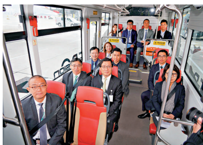
▲林世雄（第二排左一）去年試坐香港國際機場內的自動駕駛小型巴士。

林世雄說，世界各地近年不斷測試自動駕駛技術，他去年在內地不同地方多次試坐自動車。政府的10億元「智慧交通基金」已批出7個自動車及車聯網技術項目，期望透過產學研合作，讓本港的自動駕駛技術早日走向成熟。