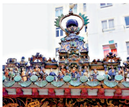
▲▼廟內外有大量精美的壁畫、灰塑、木刻、石灣陶瓷裝飾。