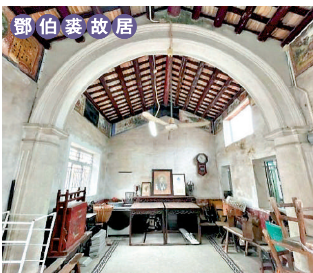
▲元朗錦田鄧伯裘故居料將會列作法定古蹟。