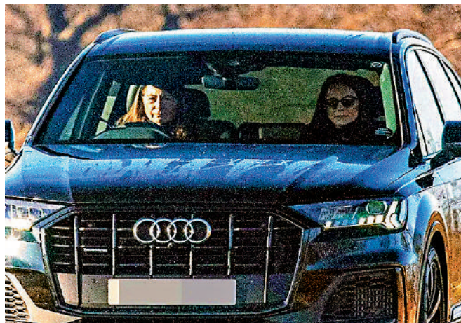
◀英國凱特王妃（右）1月接受腹部手術後，近日首次被拍到影像。

英國國防部5日表示，凱特將於6月8日參加英王查爾斯的生日慶祝活動，將會是她自1月接受手術以來首次正式履行職責。肯辛頓宮辦公室尚未確認她是否出席活動。據英國陸軍網站報道，目前正在接受癌症治療的查爾斯計劃出席6月15日的閱兵式。