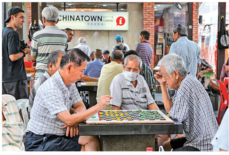
▲新加坡長者玩跳棋。

新加坡政府4日宣布，勞資政三方已達成共識，將於2026年再度分別將退休年齡和重新僱用年齡上限提高一年，至64歲和69歲，以維持生產力。新加坡2023年的總和生育率首次跌破1.0，人口老齡化也日益嚴重，為勞動市場帶來了巨大壓力。新加坡政府也鼓勵企業僱用年長員工，企業每聘請一名60歲以上的新加坡僱員，可獲得2500新加坡元（約1.46萬港元）的津貼。