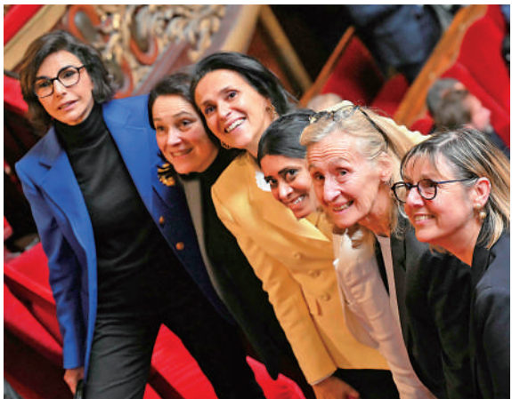
►法國議會4日通過將墮胎權納入憲法，多名女性政府官員露出笑容。

法國總理阿塔爾在投票前對議員們表示，要向所有女性傳達一個信息，「你的身體屬於你，沒有人可以為你做決定」。在投票通過後，總統馬克龍在社媒X上發文慶賀，並