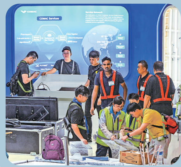
◀新加坡收緊外籍專才簽證。圖為新加坡航展的工作人員。