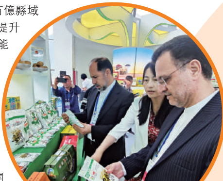
▲國外嘉賓觀看「美麗鄉村」論壇上展出的馬鈴薯加工產品。

積極推進以縣城為重要載體的新型城鎮化建設，開展城鄉融合發展三年行動，加快農業轉移人口市民化。統籌更多政策、資金、力量向縣域傾斜。挖掘潛力優勢，發展「飛地經濟」，力爭地區生產總值超百億縣域達到40個。提升開發區發展能級，完善綜合考核評價體系，力爭地區生產總值超百億開發區達到11個，省級及以上開發區經濟總量佔全省比重超過22%。