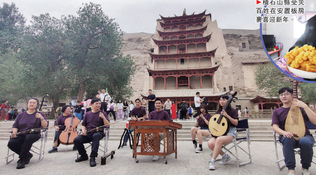
▲港澳藝團訪隴在敦煌莫高窟前演出。