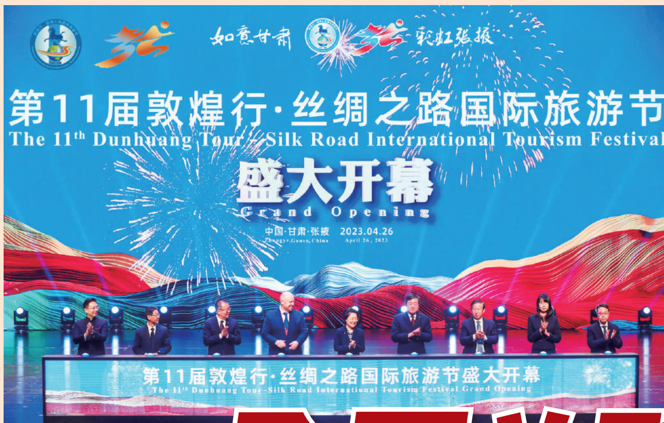
▲第11屆敦煌行·絲綢之路國際旅遊節開幕式。