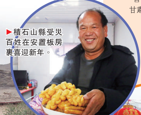
▶積石山縣受災百姓在安置板房裏喜迎新一年。