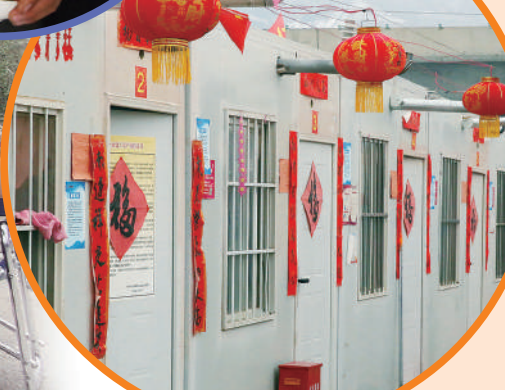
▲積石山縣受災百姓的安置區。