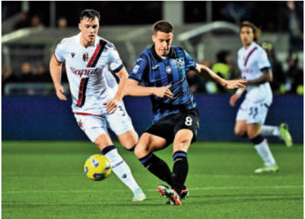
▲阿特蘭大（藍黑衫）料與士砵亭鬥攻。

【大公報訊】據ESPN FC報道：阿仙奴繼續展現行云流水的進攻，昨晨英超作客包尾的錫菲聯，上半場已狂轟5球，下半場「收油」下最終亦大破主隊6：0，創下英格蘭頂級聯賽歷史，成為首支連續3場作客以5+球差距獲勝的球隊。