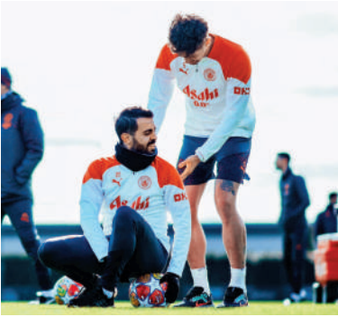
◀曼城球員神情輕鬆備戰對哥本哈根的歐聯賽事。