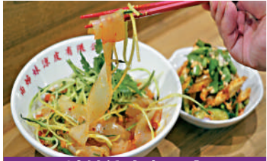
兩姊妹涼皮有限公司 惹味香涼皮

【大公報訊】記者劉碩源報道：米芝蓮指南昨日公布《香港澳門米芝蓮指南2024》的必比登推介名單，本港有67家餐廳上榜，當中7間新上榜，包括位於旺角的「兩姊妹涼皮」。該店負責人為圓夢，艱苦經營近五年，如今二度登米芝蓮，打算向旅客市場進發。開業僅10個月的文苑飯莊，在屋苑商場招呼顧客，該店負責人表示，用米芝蓮的餐廳經驗，提供高質服務予顧客，相信能吸引更多顧客。