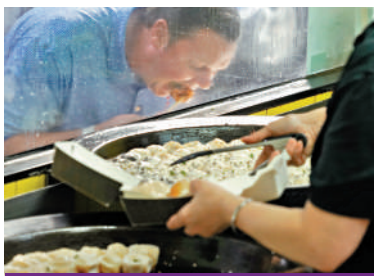
祥興記 爆汁生煎包