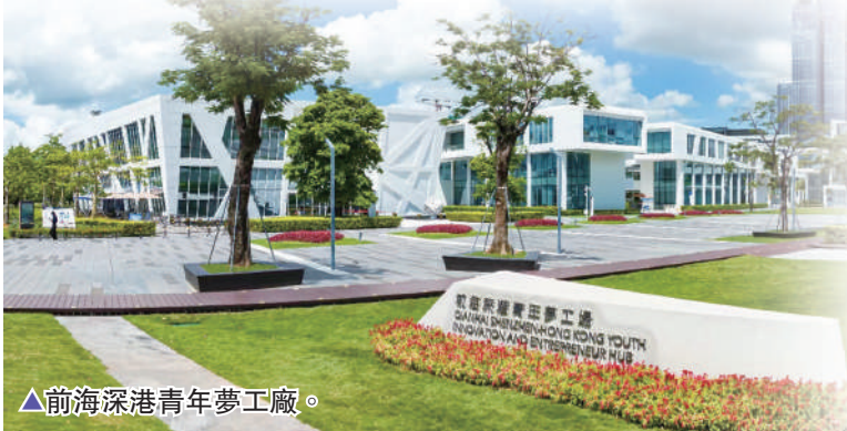
▲前海深港青年夢工廠。

結果顯示，前海整體營商水準優異，深港一體成效明顯。在世界銀行全球營商環境10項效率指標評估中，前海總分接近香港、新加坡水準，已基本實現《前海方案》提出的「營商環境在2025年具備全球競爭