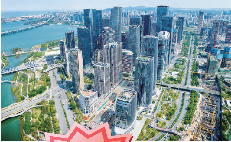
▼前海桂灣金融中心。

延續《前海方案》和《前海金融30條》等政策文件的基本原則及內容，《前海規劃》在深化金融業開放創新上提出多項細化措施，比如：支持符合條件的港澳及外資銀行、保險機構在前海設立分支機構及獨資或合資法人金融機構，以及符合條件的證券機構設立獨資或合資法人金融機構；允許香港私人銀行、家族財富管理機構等在前海設立專營機構，支持符合條件的香港資產管理機構在前海設立合資理財公司，依法開展跨境資產管理業務。《前海規劃》提出發展目標，到2025年前海的