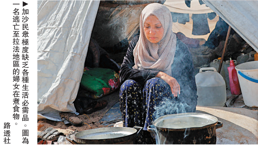
一名逃往至拉法地區的婦女在煮食物。

美國政府官員日前在一次機密簡報會上向國會通報，自去年10月本輪巴以衝突爆發以來，拜登政府利用國會審查漏洞，已秘密向以色列出售武器逾百次，包括數千枚精確制導炸彈、小直徑炸彈、小型鑽地彈和其他致命武器等。美媒稱，這100多筆不公開軍售是美國深度介入這場5個多月戰爭的最新證明。加沙地帶迄今為止已有超過3萬人死亡，美國一方面假惺惺批評以軍進攻加沙，一方面源源不斷為以軍輸送武器，盡顯其虛偽本質。