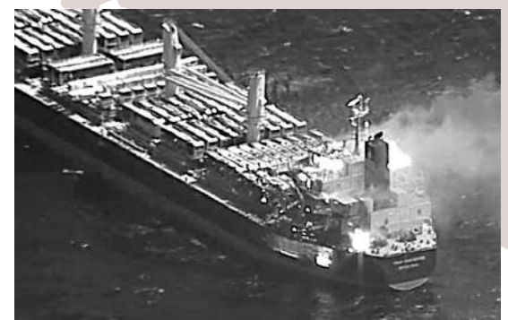
「真正信心」號被導彈擊中後起火。

月18日，胡塞武裝用導彈攻擊英國貨船「魯比馬爾」號，船隻嚴重受損並最終於3月1日沉沒。這是第一艘因胡塞武裝襲擊而沉沒的船隻。