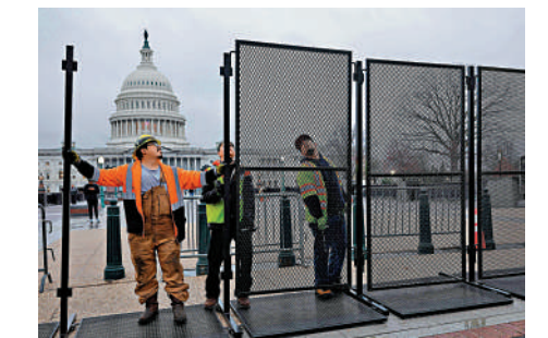
拜登於7日發表國情咨文演講，工人6日在國會大廈周圍豎起鋼架圍欄。