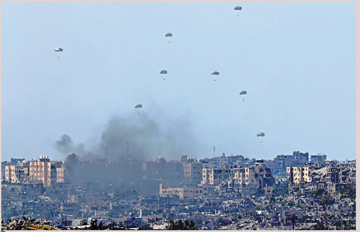
3月7日，有援助物資空投至加沙北部。當地居民稱，只有實現停火才能緩解人道災難。

【大公報訊】近年來，美國每年向以色列提供約38億美元軍事援助。去年10月巴以開戰以來，拜登政府僅公布過3筆對以軍售：去年11月價值3.2億美元的精確制導炸彈；去年12月1.4萬枚價值1.06億美元的坦克炮彈；去年12月價值1.475億美元的155毫米口徑炮彈部件。然而，多名美國官員和國會議員透露，在公開軍售以外，美國政府對以色列進行了100多筆未受到任何公開審查的軍售。這些軍售每一筆金額都不高，這意味着按照相關法律，其內容無需公開。