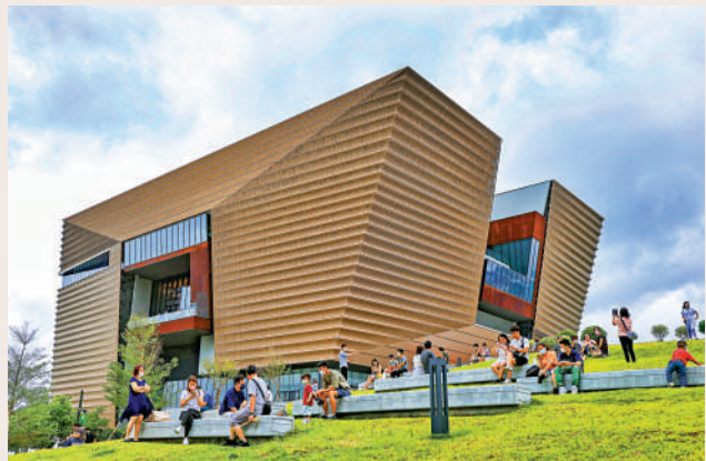
▲香港故宮文化博物館是西九文化區的地標之一。

在波瀾壯闊的強國建設、民族復興偉大征程中，要實現中國式現代化，必然包括文化的現代化，實現中華民族偉大復興必然包括文化的復興。中國式現代化的文化復興進程中，香港擁有哪些獨特優勢？可以發揮哪些重要作用？應該抓緊抓好哪些建設？