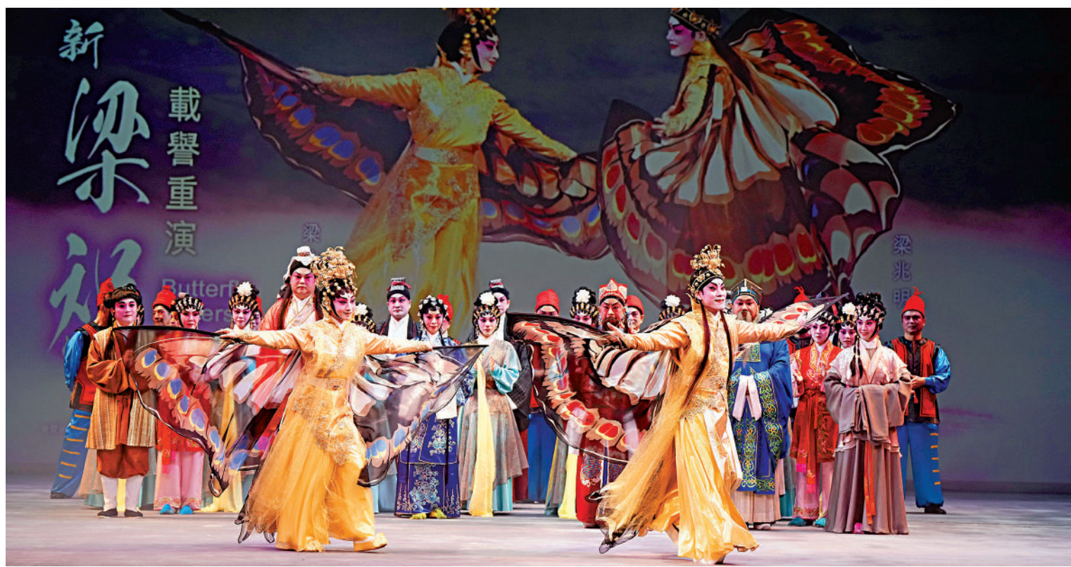
▲粵劇於2009年獲聯合國教科文組織列入《人類非物質文化遺產代表作名錄》。圖為粵劇新《梁祝》在西九戲曲中心演出。

今日起，《大公報》推出「助力文化復興 香港大有作為」系列，匯集內地與香港文藝界人士真知灼見，拆析未來粵港澳大灣區在中國式現代化文化復興中成為文化開路先鋒，以及香港作為粵港澳大灣區重要城市在機遇與發展藍圖面前，如何利用中西薈萃的文化優勢，「一國兩制」的制度優勢，背靠祖國、聯通世界的地緣優勢等獨特地位，發揮至關重要的核心作用。