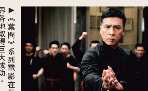
►《葉問》系列電影在世界各地取得巨大成功。

前不久在香港體育館舉行的「四海同春·2024香港各界新春晚會」上，一曲《灣區是故鄉》作為暖場歌曲在演出開始前循環播放。歌曲唱的是大灣區以香料種植、加工、貿易、出口產業鏈為紐帶，產生出諸如香港、香山、香洲、花都、芳村、莞城等與香料相關的地名，體現出大灣區文化交匯、文明共融的歷史背景與發展優勢。「大灣區是一個擁有8400萬人口的中