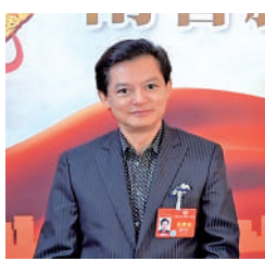
莫華倫（全國政協委員、香港歌劇院藝術總監）

●香港特殊的地理位置和歷史因素，使得它在國際上的便利性更高。以香港為基地，把中國傳統文化的精神和自信傳遞到全世界，是非常重要的，也是更加容易的。