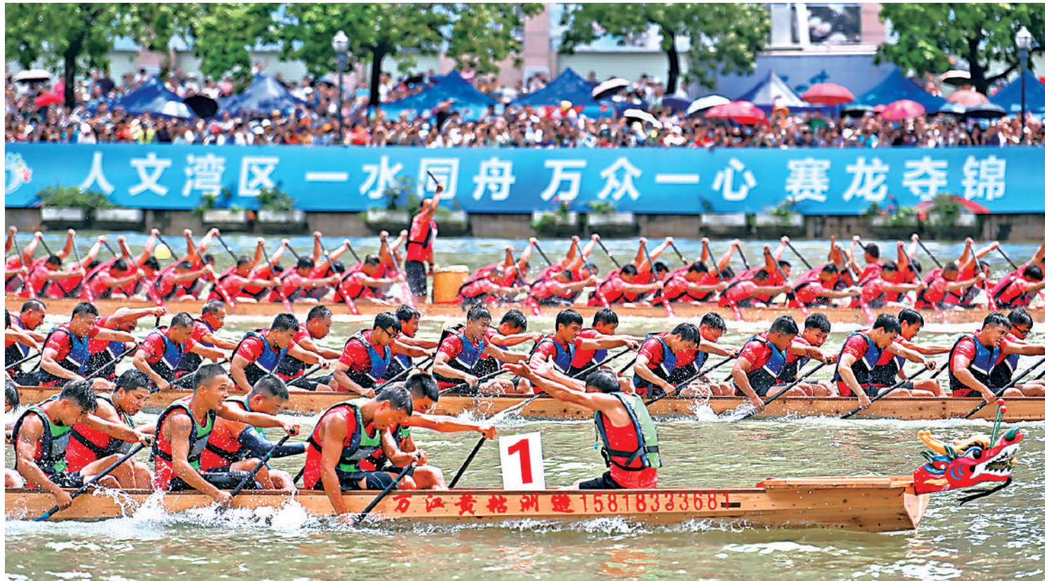
▲2023年粵港澳大灣區（廣東）龍舟邀請賽暨東莞龍舟錦標賽在東莞市沙田鎮舉行。邀請賽以傳統龍舟文化為紐帶，推動粵港澳城市人文交流，促進非遺保護傳承。