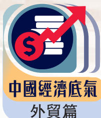
中國經濟底氣 外貿篇

春節剛過，國家級船舶出口基地泰州一派繁忙景象，十多艘遠洋運輸船正在船塢內加緊建造。基地出品的LNG雙燃料動力船、超大型集裝箱船等高端船型，已成為招攬國際訂單的王牌，繁榮景象僅是中國出口增長的縮影。海關數據顯示，今年首兩月中國貿易進出口總值6.61萬億元，同比增長8.7%，連續五個月實現增長，且進出口規模創歷史同期新高。商務部部長王文濤日前在全國兩會專題記者會上指出，出口商品正向價值鏈上游攀升，「鞏固外貿基本盤，我們有信心、有底氣」，商務部將從擴展中間品貿易、促進跨境電商出口、提高貿易數字化水平、推進貿易綠色發展，四方面發力，培養外貿發展新動能。