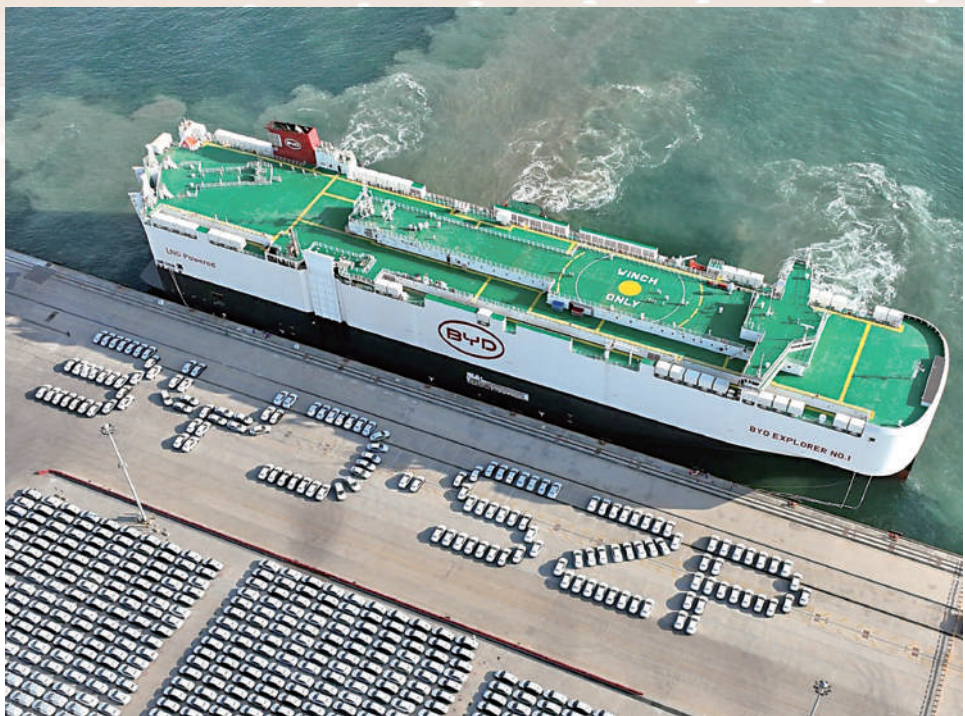
▲1月14日，比亞迪「開拓者1號」貨輪抵達深圳港小漠國際物