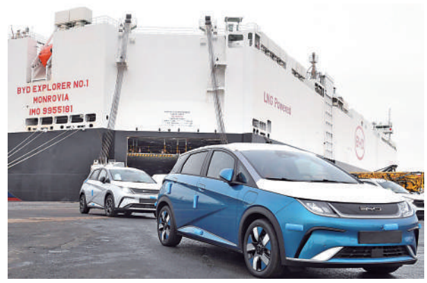
▲2月26日，滿載3000輛新車的比亞迪「開拓者1號」貨輪從深圳抵達德國不來梅港。

中國服務貿易指南網指出，全球價值鏈可分為三大環節，上游的技術環節包括研發、創意設計、技術、技術培訓等環節。