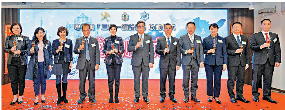
▲主禮嘉賓昨日在粵港澳「三地一鎖計劃」啟動儀式上祝詞。

人才辦將致力為來港人才提供支援服務，將定期舉辦涵蓋就業、教育、定居、創業等範疇的專題講座，協助抵港人才融入社會。