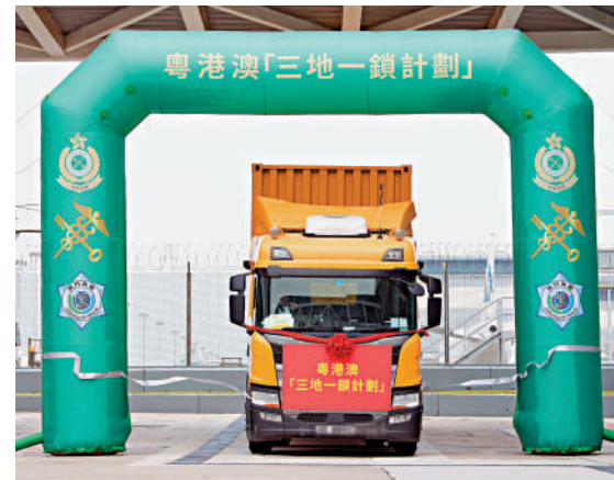
▲粵港澳「三地一鎖計劃」正式啟動，第一輛運輸車輛從DHL中亞區樞紐中心出發。

近百名嘉賓出席今次啟動儀式，包括內地海關代表、澳門海關代表、香港中聯辦代表、香港特區政府官員、立法會議員、香港機管局代表、物流業協會、物流運輸業聯絡小組及私人機構代表等。