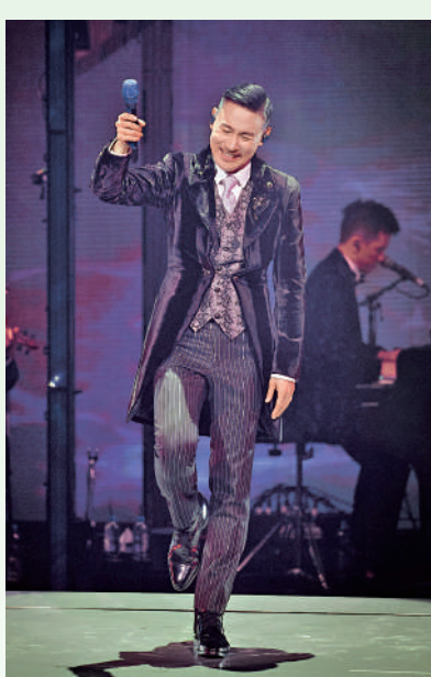
▲張學友於去年展開巡迴演唱會，至2月23日起移師上海舉行。資料圖片

【大公報訊】張學友因身體不適，主辦方前日宣布取消3月8日、9日、10日在上海舉行的「張學友60+巡迴演唱會」，並表示「謝謝關心，張生在休息」。有關張學友的健康情況，昨日他本人親自作出回應。