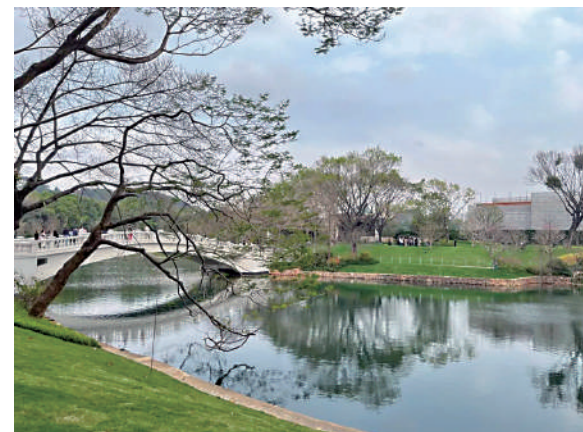
▲越秀·觀樾把中心湖、太陽湖及周邊的生態修復，打造連片湖區。