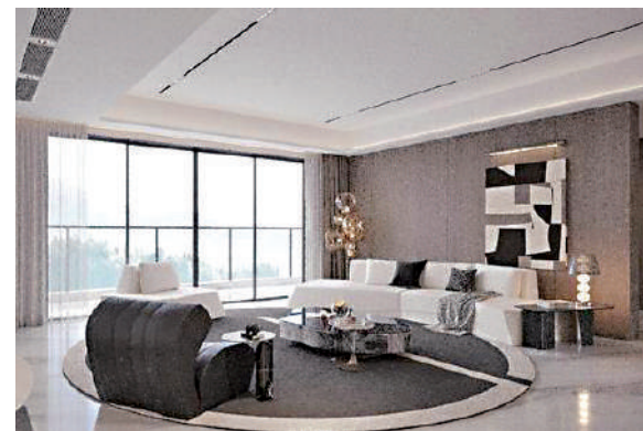
▲越秀·觀樾布置簡潔，客廳外連露台外望美景。

配套方面，項目配建15班幼兒園和24班小學；片區內的9年一貫制學校，較早前宣布引入天河外國語學校辦學。銷售人員表示：「雖然目前項目的交通和商業還未完善，但隨着項目的全面開發，結合未來黃村舊改的實施，將帶動整個片區的發展。」