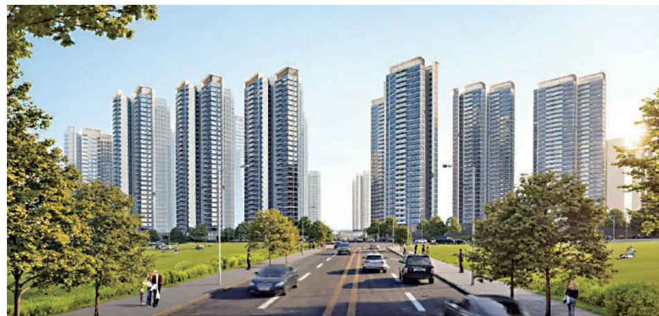
▲華潤置地·天河潤府由12幢住宅組成，戶型全數向南。