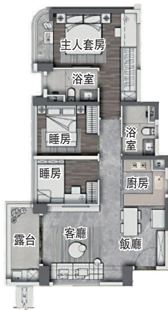
▲華潤置地·天河潤府81平方米三房兩廳戶型圖。

值得注意的是，該片區離地鐵比較遠，是天河區少數的地鐵真空地帶，日常出行靠自駕或公交轉地鐵。