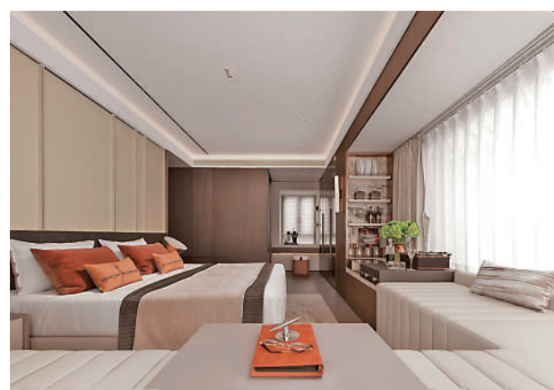
▲華潤置地·天河潤府拓寬窗台，增加舒適度。