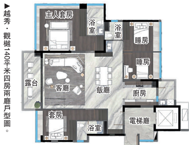
▲越秀·觀樾140平方米四房兩廳戶型圖。

天河區作為廣州房地產核心區域，歷來備受矚目。隨着城市化不斷推進和人口增長，天河區樓市保持活躍。2024年春節小陽春期間，天河區的越秀·觀樾、華潤置地·天河潤府、中國鐵建·招商蛇口·西派天河序分別開放示範單位，這三個項目涵蓋了改善、剛需改善及高端改善三個產品端。