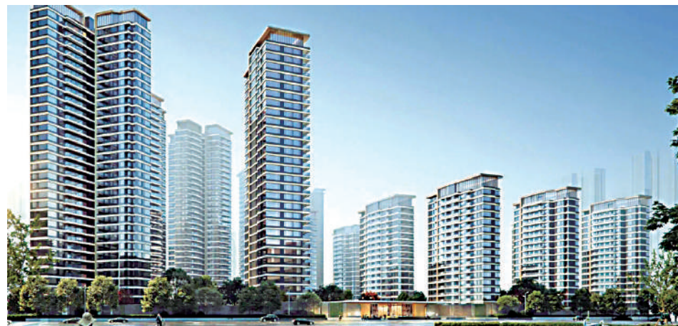
▲中國鐵建·招商蛇口·西派天河序共16幢，樓高17層。