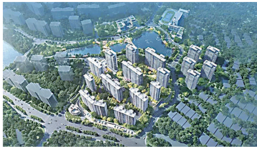
▲越秀·觀樾各幢住宅錯位分布，確保單位景觀及私密性。