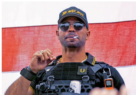
▲美國極右翼組織「驕傲男孩」前主腦塔里奧。

檢方強調，作為美國歷史上規模最大的刑事調查案件之一，針對國會暴亂嫌疑人的追捕仍在進行中。