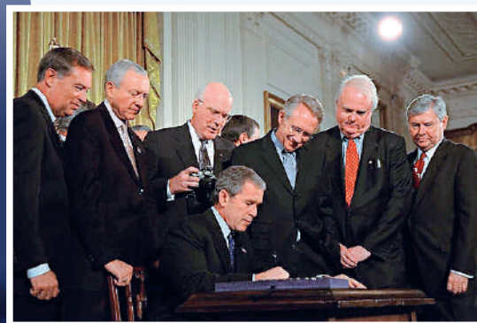
▲2001年「9·11」恐襲（下圖）發生短45天後，就由時任美國總統小布什簽署，《美國愛國者法案》完成立法。

過去20年間，英國多次出和修改涉國家安全類法案，包括2021年通過《國家安全投資法》，以「國家安全」為由無端干預中國對英投資。