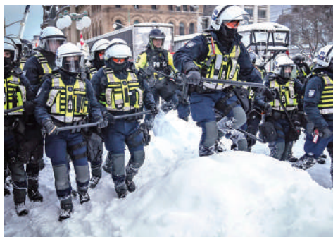
▲加拿大警察準備清場。

美國在2001年「9·11」事件後，以45天「閃電」速度通過《美國愛國者法案》立法，以保護美國本土免再受恐怖主義襲擊。「9·11」恐襲發生21天後，10月2日，時任美國司法部長阿什克羅夫特就向國會提交相關法律草案。10月11日，國會參議院審議通過最終法案；翌日，眾議院通過包括參議院法案大部分文本的法案。