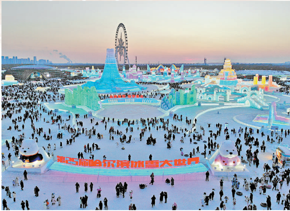
▲2024年春節，文旅市場實現「開門紅」。圖為2月15日，遊客在哈爾濱冰雪大世界園區內遊玩。