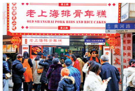
排隊2月12日，市民在《繁花》帶火的上海排骨年糕。

「近幾年，我國的服務消費快速發展，2013年到2023年，居民人均服務性消費支出佔比從39.7%提升到45.2%，提高了5.5個百分點。」商務部部長王文濤表示，未來一段時期，中國服務消費的空間和潛力還很巨大。