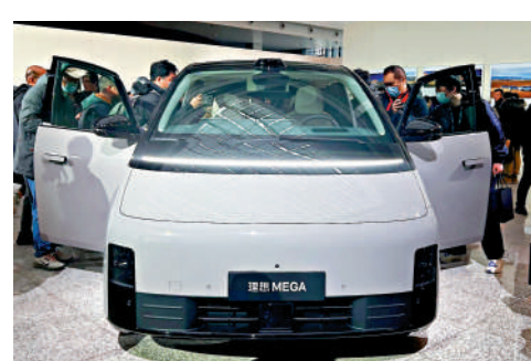
▲理想MEGA本月開始交付，不過在內地網絡出現不少惡搞改圖。

等字樣貼於車身。因其嚴重侵害理想汽車的產品形象及品牌聲譽，侵害了理想汽車的名譽權，理想已向部分平台發出投訴通知函，要求平台刪除相關內容。理想汽車3月4日股價曾跌10.7%，昨日股價逆市跌0.35%，收報144.2港元，與3月3日的收市價179.2港元相比，六個交易日累計跌35港元或19.5%。