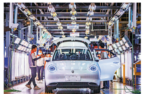
▲資金炒高新能源車股，鋰電池股走勢更加搶眼。

然而，大摩預期，電池價格戰已近尾聲，並上調行業龍頭寧德時代 (300750) 評級至增持，薦為行業首選，目標價210元人民幣。寧德時代A股昨升14.4%，收報180.85元人民幣。大摩稱，寧德時代準備通過新一代大規模生產線，以提高成本效率，並擴大在淨資產收益率方面的優勢，看