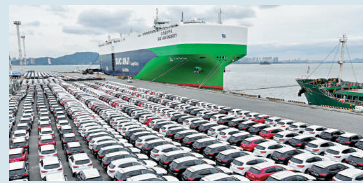
▲今年前兩個月，中國汽車出口增長超三成，出口延續良好表現。