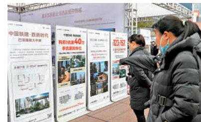
▲民眾在2024重慶春交會現場了解樓盤信息。