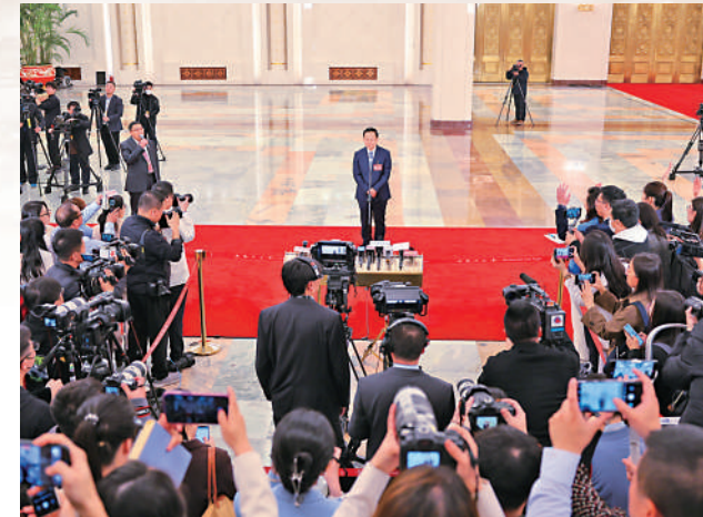
▲3月11日，第十四屆全國人民代表大會第二次會議第三場「部長通道」集中採訪活動在北京人民大會堂舉行，文化和旅游部部長孫業禮接受媒體採訪。