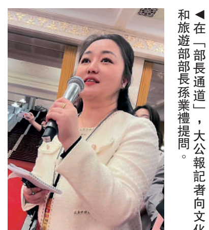
▲在「部長通道」，大公報記者向文化和旅游部部長孫業禮提問。

在，文旅部門也採取了一些辦法，特別是一些硬性的措施，一是實名購票、實名入場，二是要求所有大型文藝演出的門票公開銷售的比例不得少於85%。「這兩條很硬的措施極大地限制了黃牛倒票的空間，加上其他措施，應該說倒票的現象已經大有好轉。」