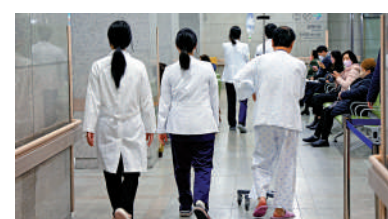
▲韓國醫生罷工潮持續，醫務人員11日走進仁川一家醫院。

題，並建立民官醫等各方共同參與的對話機制。但韓國總統尹錫悅指示，要按原則迅速推進包括醫科生擴招在內的醫療改革，全力緊急應對急診患者和重症患者，確保毫無疏漏。