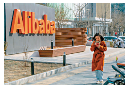
▲內地投資者喜歡趁港股回調時加碼，科技股是受惠板塊之一。

恒指公司又發現，港股近年跌跌不休，可是在截至2024年2月止的24個月，佔23個月都錄得內地資金每月資金淨流入，只有2023年6月份錄得北水流出58億元。恒指公司認為，南向交易對港股影響力不斷提升，而且內地資金過去24個月幾乎每月都淨流入，說明內地投資者對港股前景普遍持正面態度，願意在港股下跌期間，採取逢低買入策略。自2016年12月至2024年3月6日止，南向交易累計淨流