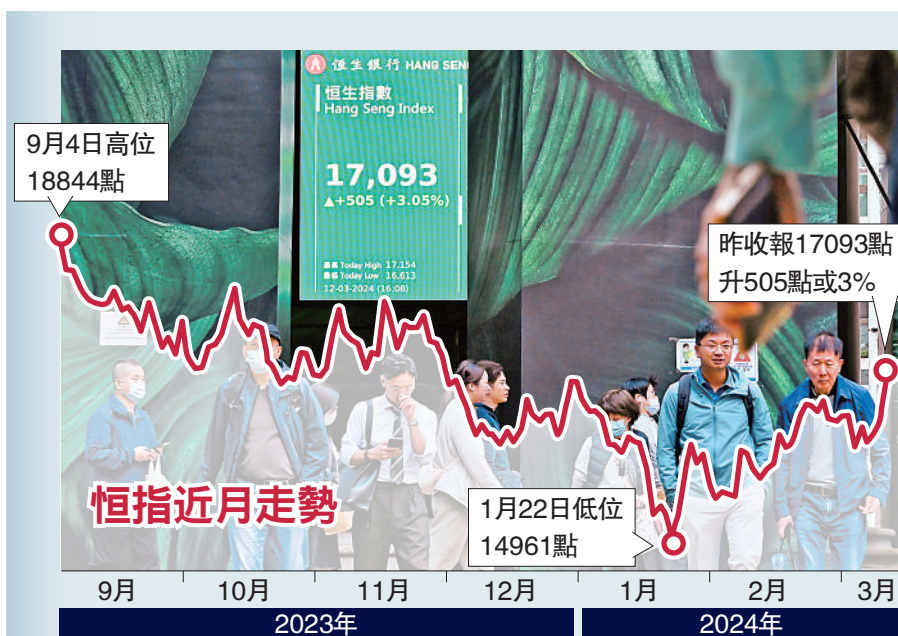
▲港股連漲三日，昨日抽高505點，重上萬七關口。