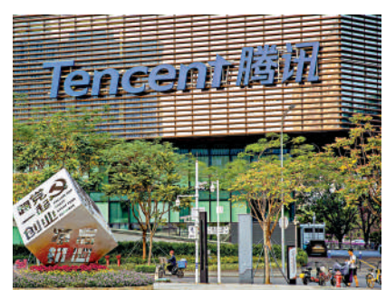
▲專家估計騰訊短期可望突破297元阻力，上望310元。

東方證券也看好阿里，認為阿里加大股份回購力度，彰顯對前景充滿信心，由於董事會已批准將股份回購計劃增加250億美元，有效期至2027年3月底，上調回購規模後，未來3個財年將有353億美元股份回購額度。此外，目前其市盈率（PE）估值達到17061億元，對應每股約95.2元，較昨日收市價74.85元高出27%，故維持買入評級。