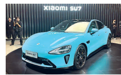
▲小米首款電動車SU7將於3月28日正式上市。

雷軍提到，小米汽車從0到1，與14年前小米手機從0到1，小米的成長階段和面臨的用戶期待非常不同，小米汽車需要做出點不一樣的東西，其中最重要的是智能科技，相信市場對小米、對新