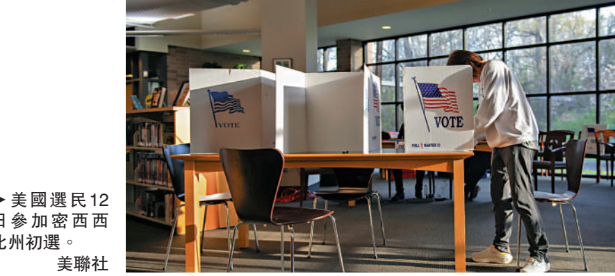
▶美國選民12日參加密西西比州初選。