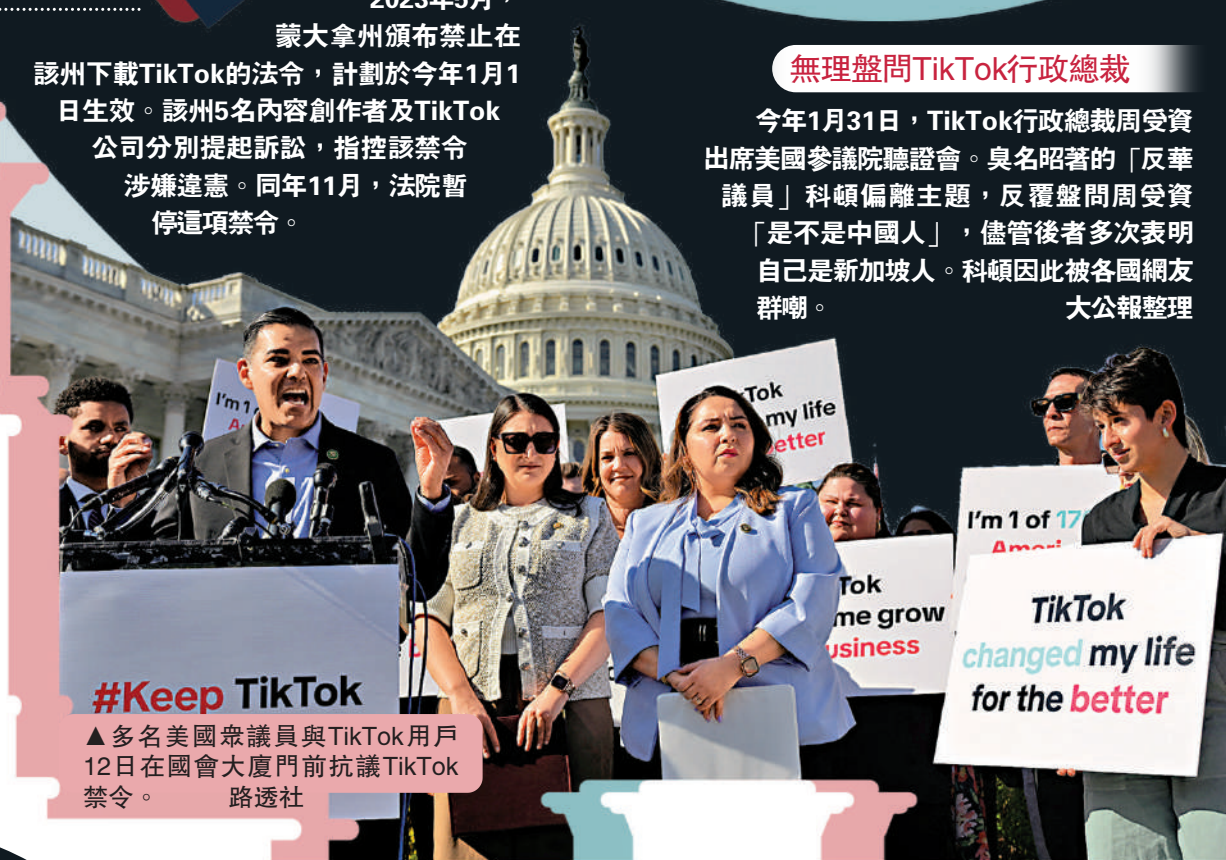
▲多名美國眾議員與TikTok用戶12日在國會大廈門前抗議TikTok禁令。

今年1月31日，TikTok行政總裁周受資出席美國參議院聽證會。臭名昭著的「反華議員」科頓偏離主題，反覆盤問周受資「是不是中國人」，儘管後者多次表明自己是新加坡人。科頓因此被各國網友群嘲。 大公報整理