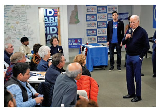
◀拜登（右）11日在新罕布爾州參加競選活動。美聯社

頻，痛斥拜登是「美國歷史上最糟糕的總統」。近日，二人在邊境管控、墮胎權、美國經濟、對烏政策等議題上互相攻訐，凸顯兩黨對立。美聯社表示，拜登和特朗普的再次交鋒勢必加劇美國尖銳的政治和文化分歧。南卡羅來納州選民丹·霍爾泰爾直言，特拜二人只知道「門來門去」，美國未來幾年的情況恐怕會比現在更糟糕。中國外交部發言人汪文斌13日就美國兩黨總統提名問題表示，美國大選是美國的內政，中方始終秉持不干涉別國內政原則，不干預美國大選。不管誰當選下一屆美國總統，我們都希望美方能夠同中方相向而行。