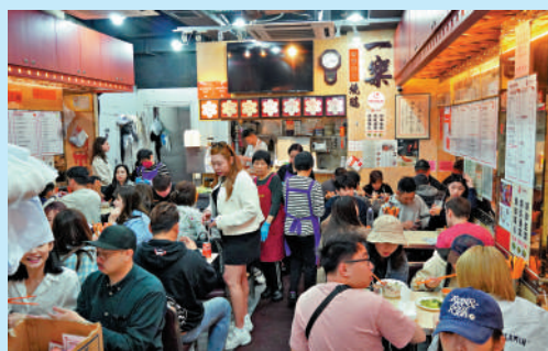
▲多間米芝蓮星級食肆表示，優質服務能令顧客感到物有所值，所以近年透過引入電子支付等提升服務。