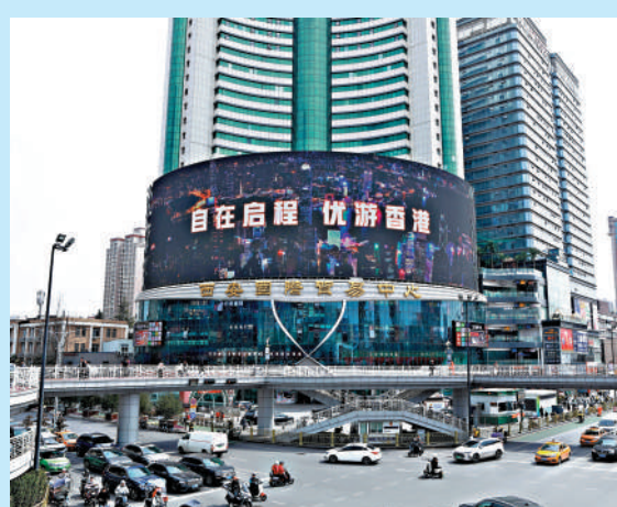
▲香港旅發局全方位宣傳，吸引西安、青島個人遊旅客到訪，並在西安小寨十字東南角國貿大廈播放香港旅遊宣傳片。