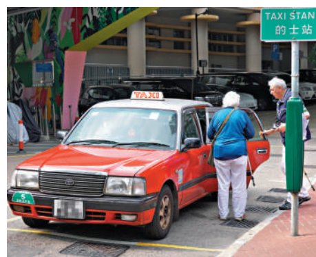
▲大公報記者在山頂所見，的士正常收費，暫未見「黑的」出現，反映有關問題已有所改善。

旅遊發展局預計，今年訪港旅客有4600萬人次，較去年升35%；入境處數字顯示，今年首兩個月平均每日有約13萬旅客