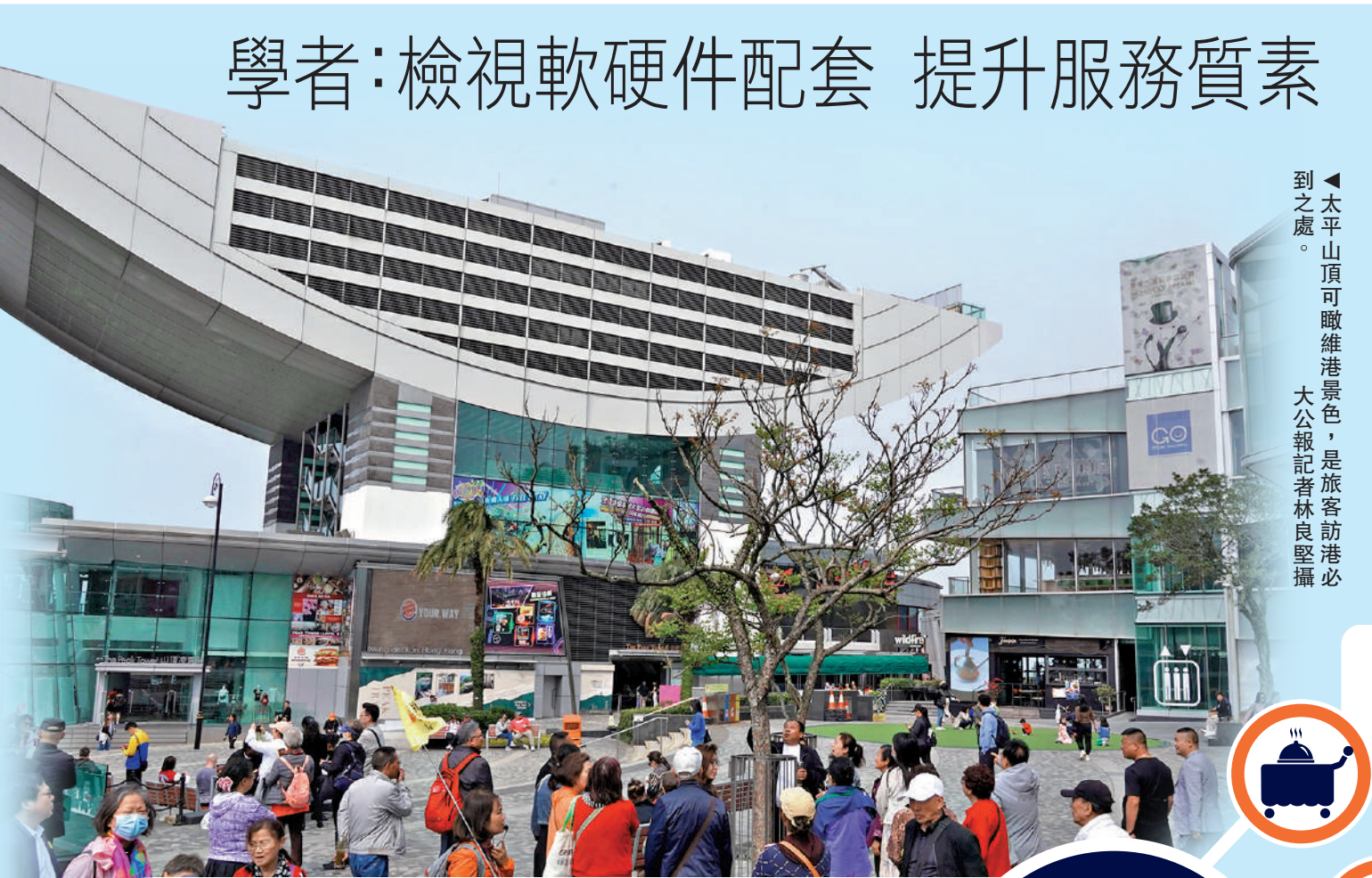
太平山頂可俯瞰維港景色，是旅客訪港必到之處。