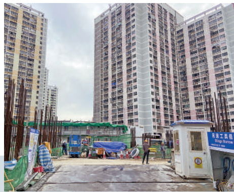
▲華富邨重建搬遷安排公布，華安樓和華樂樓的居民會率先在2026年搬到華景街新落成的屋邨。

政府在2014年施政報告提出華富邨重建計劃，房屋署於2016年透露，華富邨重建三期進行，希望2024年完成第一期重建和接收。薄扶林南五幅用地（即華景街、華樂徑、華富北、雞籠灣南及雞籠灣北）和華富邨現址，用於接收受重建影響的華富邨居民。