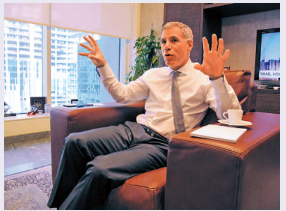
▲艾橋智表示，儘管中國經濟正面對逆風，但有信心中國可以克服短期困難。