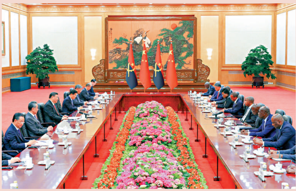
▲3月15日下午，國家主席習近平在北京人民大會堂同來華進行國事訪問的安哥拉總統洛倫索舉行會談。