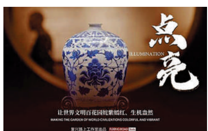
▲《點亮》講述陶瓷產業發展過程中全球文明交流互鑒故事。

在全球文明倡議提出一周年之際，全球文明倡議中英雙語主題短片《點亮》（英文名《Illumination》）15日在國內外互聯網平台正式上線。該片講述了陶瓷產業發展過程中全球文明交流互鑒的動人故事。時長9分多鐘的主題短片，濃縮了「文明之光」「薪火相傳」「照亮蒼穹」三個片段，通過多位人物的個人經歷，分別講述了彩陶修復師的故事、景德鎮「洋景漂」的故事、高科技陶瓷在航天和深海探測領域廣泛應用的故事。短片以陶瓷作為貫穿全篇的線索和主要視覺符號，借陶瓷穿越古今、縱貫東西、淬火而生的特性，闡釋了「文明因多樣而交流，因交流而互鑒，因互鑒而發展」主題內核。