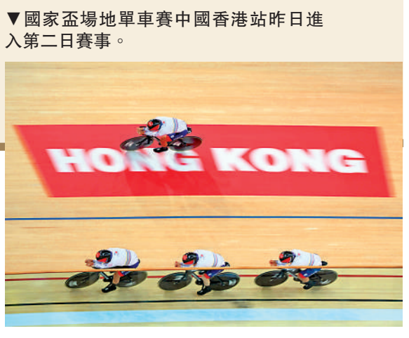
▼國家盃場地單車賽中國香港站昨日進入第二日賽事。