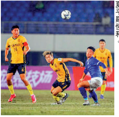
▲廣西布山(黃衫)揭幕戰擊敗寧夏平羅恆利。政策環境，在比賽場地、訓練場地建設等方面給予支持，職業足球發展進入「快車道」。今年3月9日舉行的2024中國足球協會甲級聯賽揭幕戰，廣西平果哈嘹國晶隊主場2：0勝江西廬山隊，迎來賽季「開門紅」。