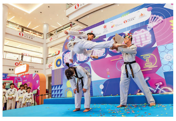
▲奧夢成真教練帶領小學生展現跆拳道訓練成果。