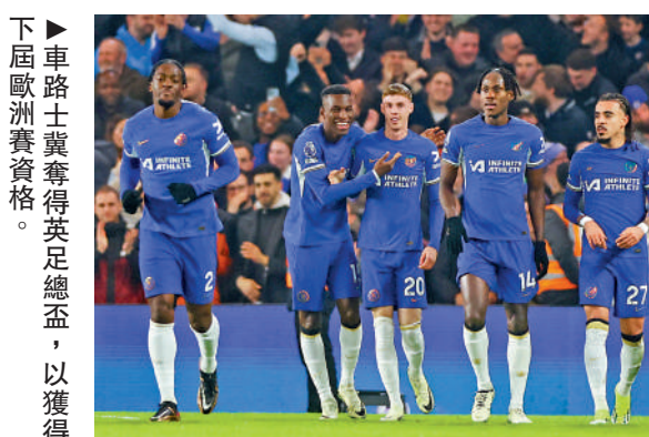
車路士翼奪得英足總盃，以獲得下屆歐洲賽資格。