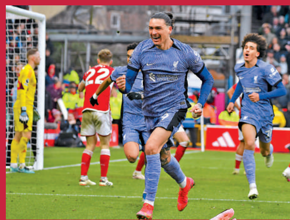
利物浦前鋒紐尼（前）近況大勇。