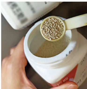
▲複方濃縮中藥顆粒。