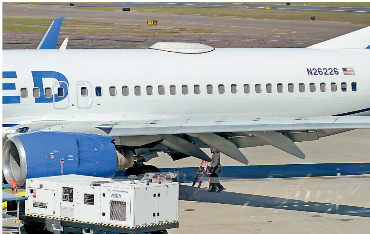
▲美聯航波音客機3月15日降落梅德福機場後才發現機身外部面板缺失。

●2月19日，美聯航一架從舊金山飛往波士頓的波音757-200型客機，起飛後因機翼受損而改道前往丹佛。